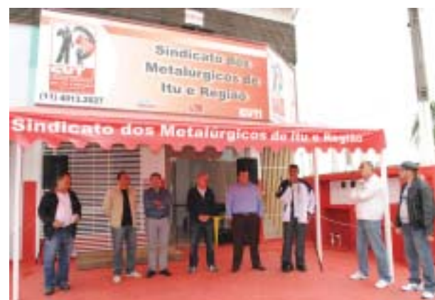
Inauguração da Subsede da Cidade Nova