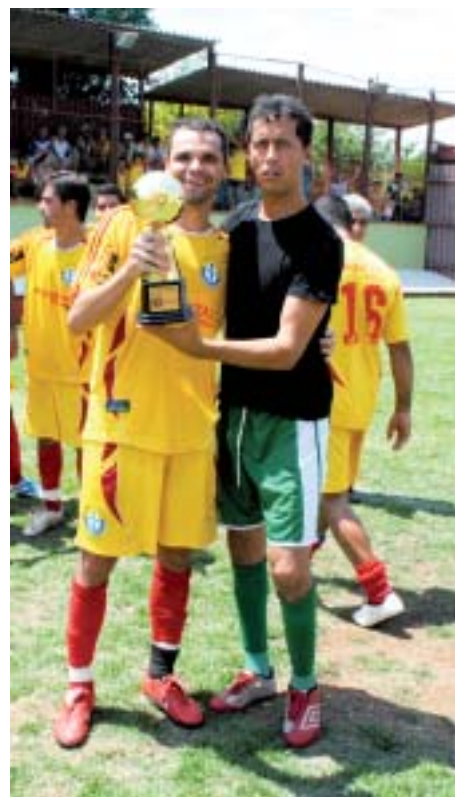
Troféu Artilheiro - Audax