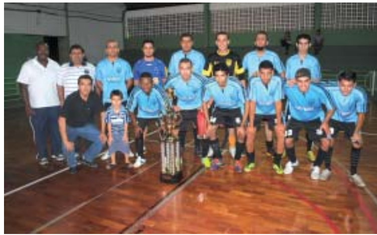
Equipe Unimetal - Vice Campeã