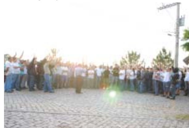
Paralisação na Siadrex