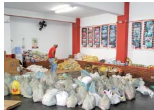
Organização dos Alimentos