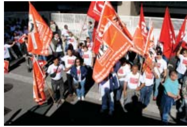
Entrega da pauta da Campanha Salarial 2012