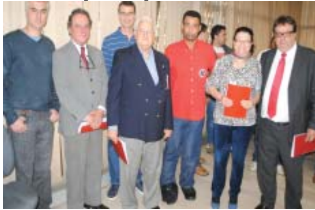
Entrega da pauta da Campanha Salarial 2012