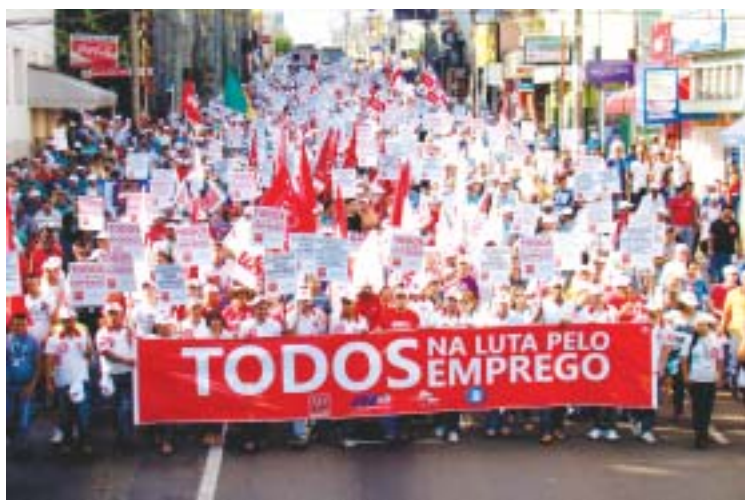
Ato em São Carlos

O CRM (Centro Recreativo dos Metalúrgicos) recebe melhorias para receber melhor os associados (as)