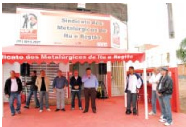
Inauguração da Subsede da Cidade Nova