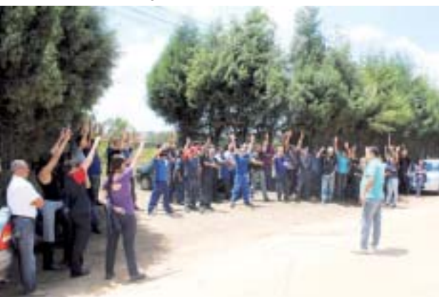
Paralisação na Merssen