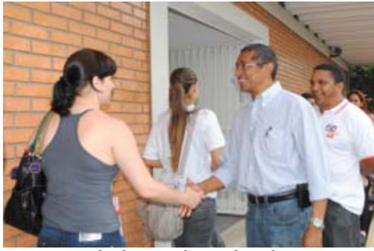
Dep. Federal Vicentinho agradecendo os votos