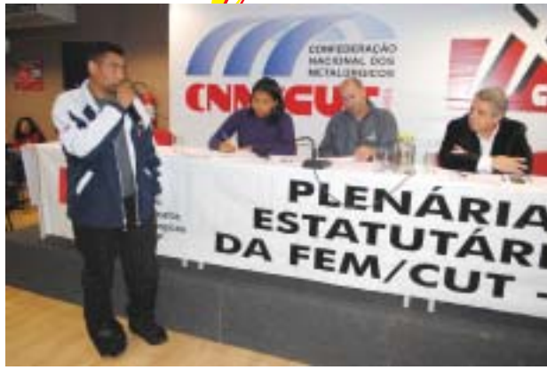
Plenária para Campanha Salarial 2012