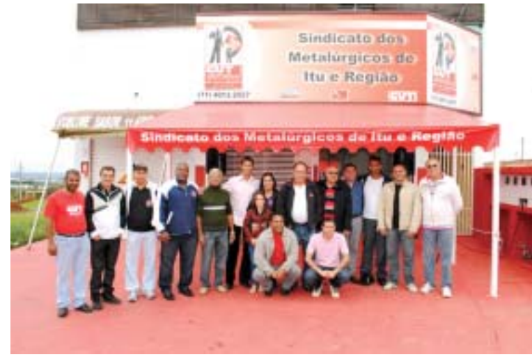
Inauguração da Subsede da Cidade Nova