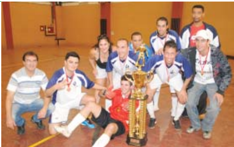
Equipe Amigos da Hydro - Campeã