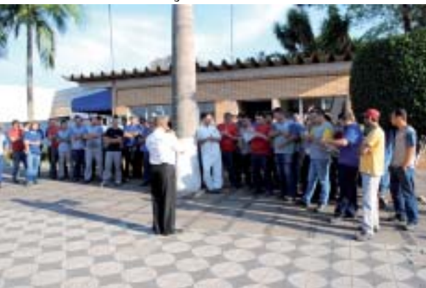
Paralisação na Taunus