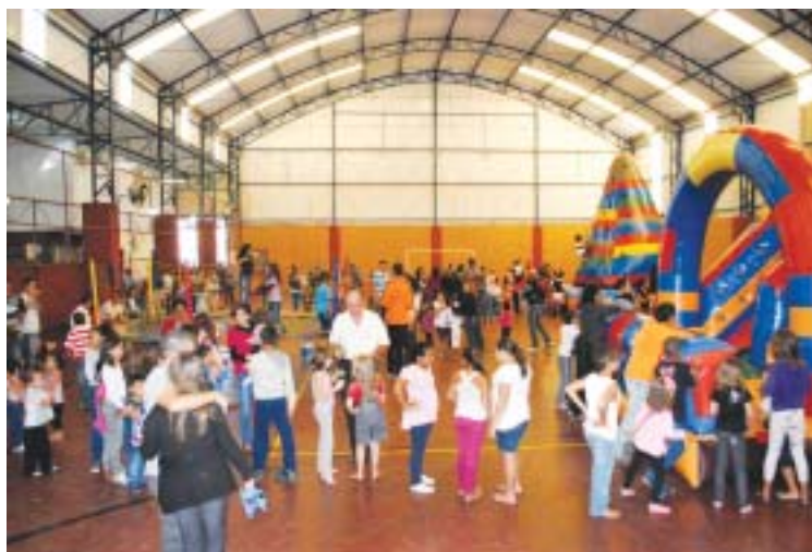
Festa do 1º de Maio de 2012