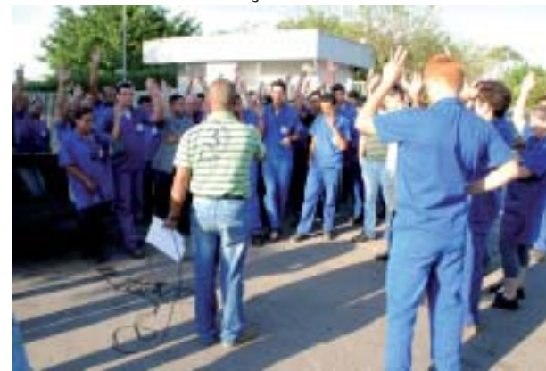
Greve na Isolet