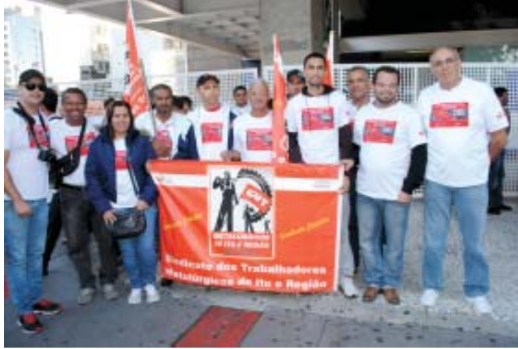
Entrega da pauta da Campanha Salarial 2012