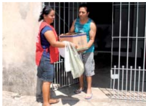
Doação da população