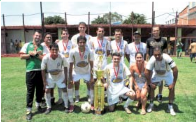
Equipe Karosso FC - Campeã