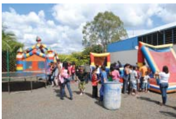
Festa do 1º de Maio 2012