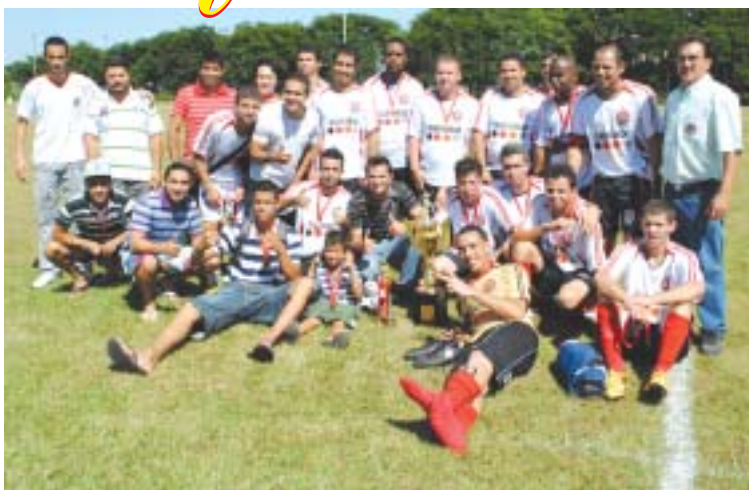
Equipe UFC Mabe - Campeã