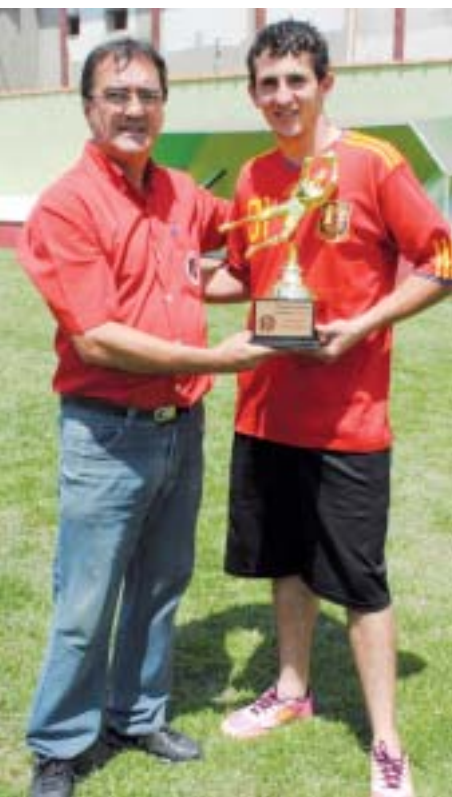
Troféu Defesa Menos Vazada