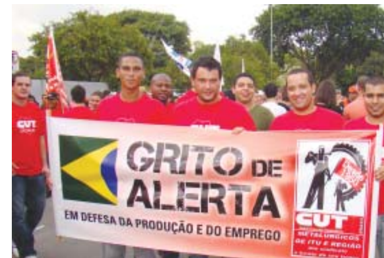
Companheiros no Ato Grito de Alerta