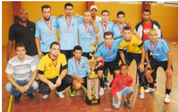
Equipe Unimetal - Vice Campeã