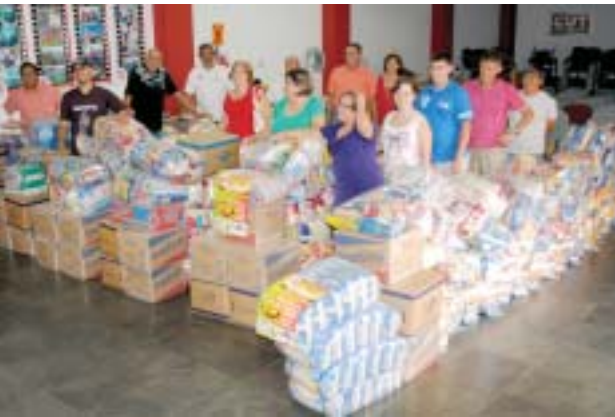
Entrega de alimetnos: Natal Sem Fome 2011