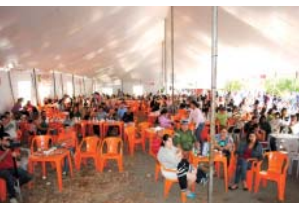
Festa do 1º de Maio 2012