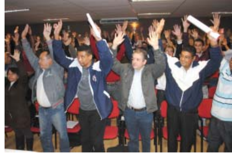
Plenária para Campanha Salarial 2012