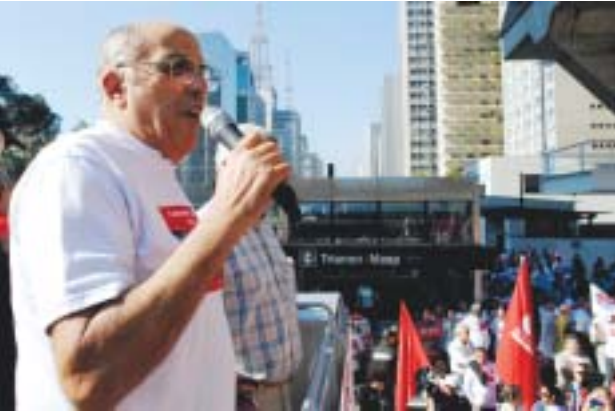
Entrega da pauta da Campanha Salarial 2012