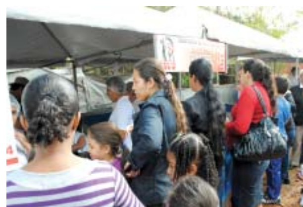
Festa do 1º de Maio 2012