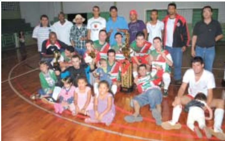
Equipe Ethos - Campeã