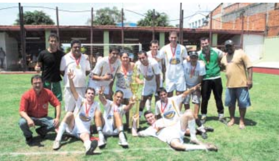
Equipe Karosso FC - Bicampeã

Ao todo participaram 32 equipes, que disputaram o campeonato em três campos e oito finais de semana.