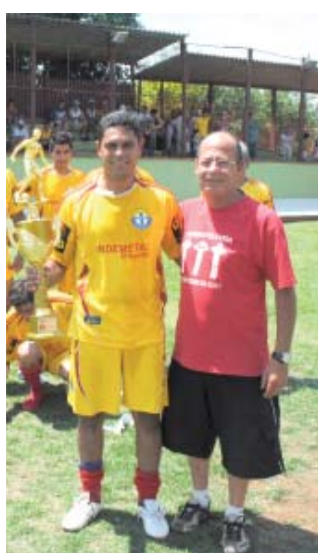
Troféu Disciplina - Audax