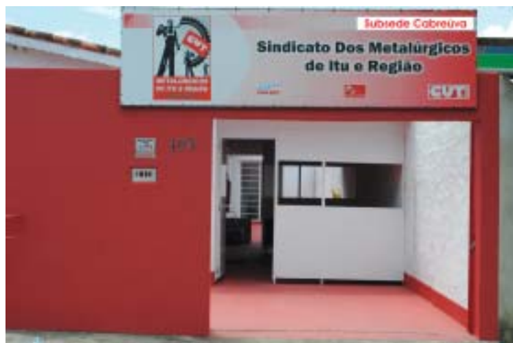
Subsede em Cabreúva

No boletim de Abril, é publicada a ficha de ins-