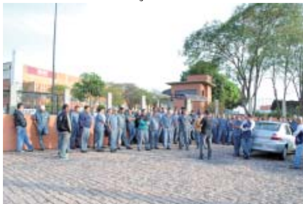
Paralisação na Vérdez