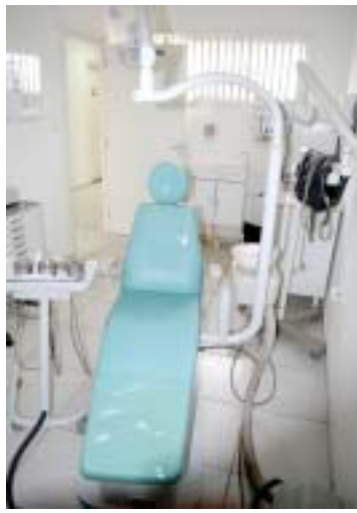
Consultório odontológico e sala de atendimento jurídico