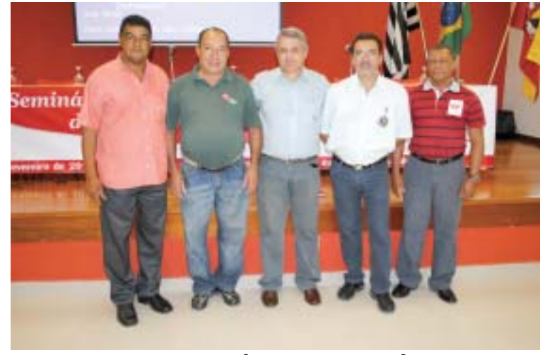
Congresso da FEM em Sorocaba