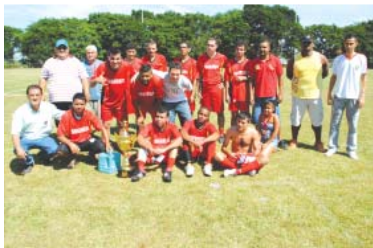
Equipe Siadrex - Vice Campeã