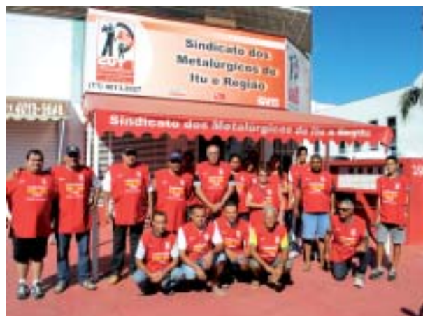
Equipe de arrecadação

Bairros: Padre Bento, Jardim Padre Bento, Vila Mariah, Vila Progresso.