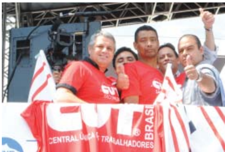
Dorival com lideranças sindicais da CUT