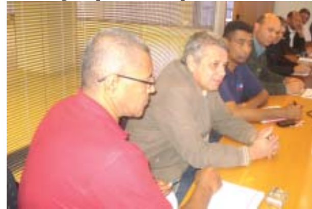
Negociações da Campanha Salarial 2012