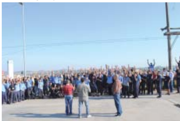
Paralisação na Siemens