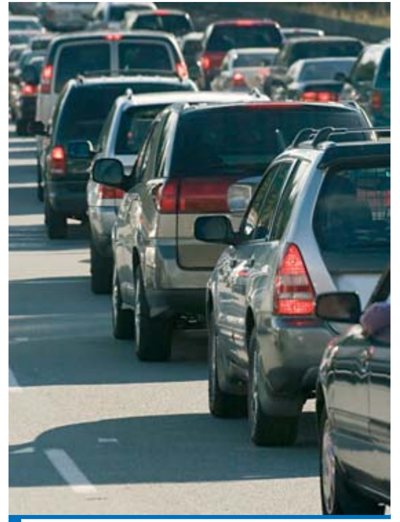
A procura deve ser mantida com a prorrogação do acordo do IPI até junho

O Governo Lula anunciou na semana passada a prorrogação do IPI (Imposto sobre Produtos Industrializados) reduzido para o setor automotivo até o dia 30 de junho.