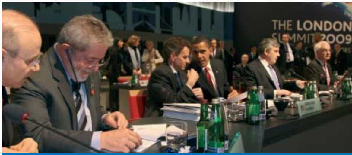
O presidente Lula durante a primeira sessão de trabalho dos chefes de Estado e de Governo do G20

Ao final do encontro do G20 realizado em Londres na semana passada, ficou decidido que as principais potências econômicas e países emergentes deverão injetar até 5 trilhões de dólares na economia global até o final do próximo ano para criar empregos e evitar uma nova crise financeira no futuro.