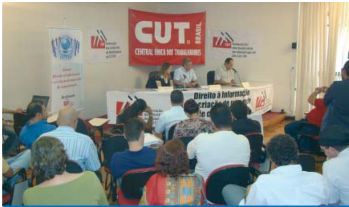
Dirigentes sindicais e jornalistas participaram do evento no qual foi lançado o novo portal www.fem.org.br

Na última sexta-feira, dia 03, aconteceu no auditório da CUT em São Paulo, o lança-