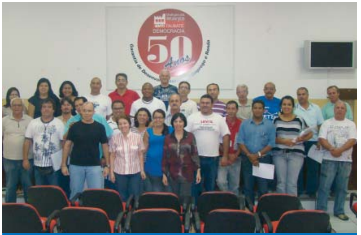
Participantes do curso receberam informações sobre o trabalho do INSS, bem como sua estrutura de funcionamento

O curso que teve duração de 16 horas abordou temas