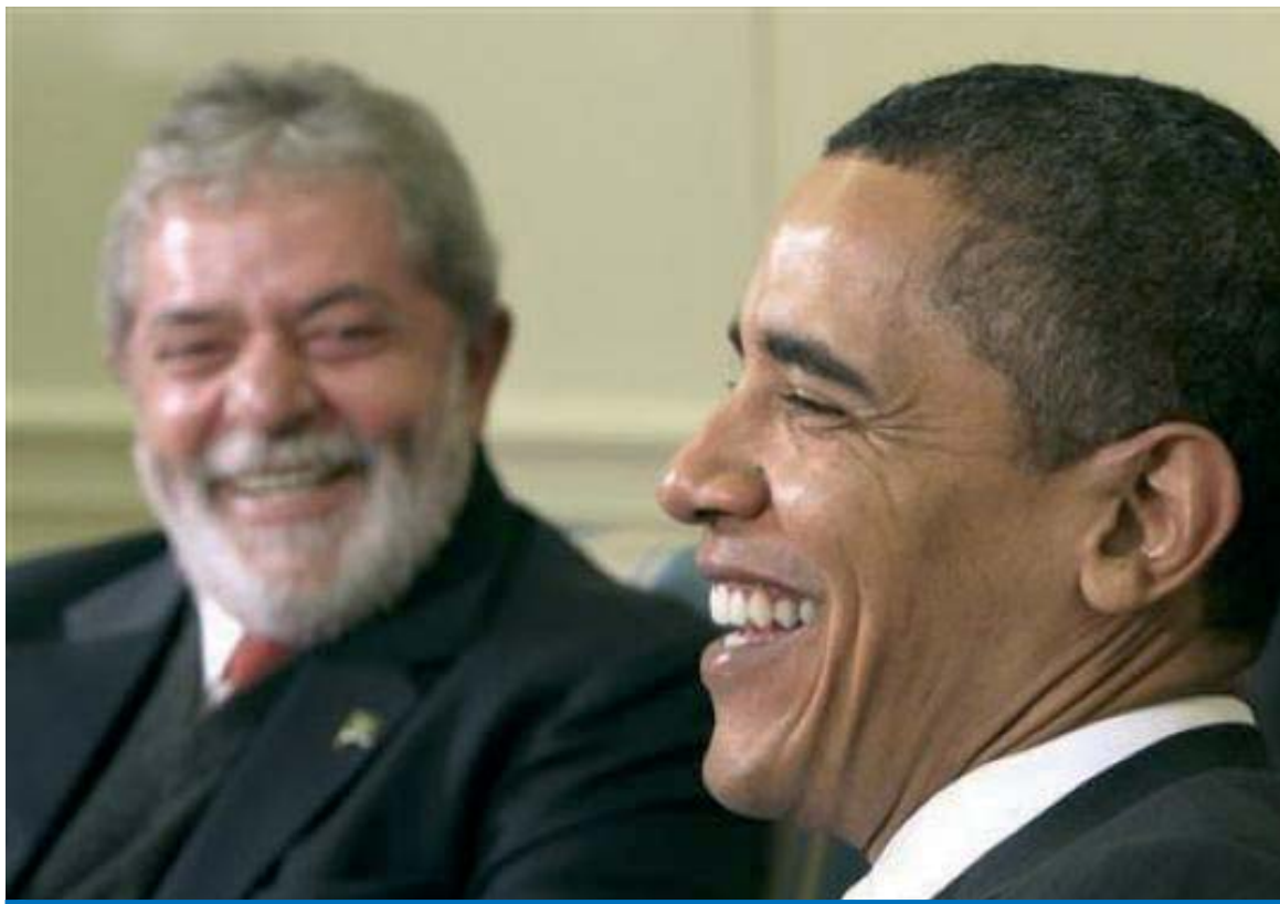
Presidente Obama reafirma a postura de Lula como estadista e do Brasil como país chave na economia mundial

A afirmação de Obama reconhece o trabalho de Lula pela estabilidade da economia brasileira e suas