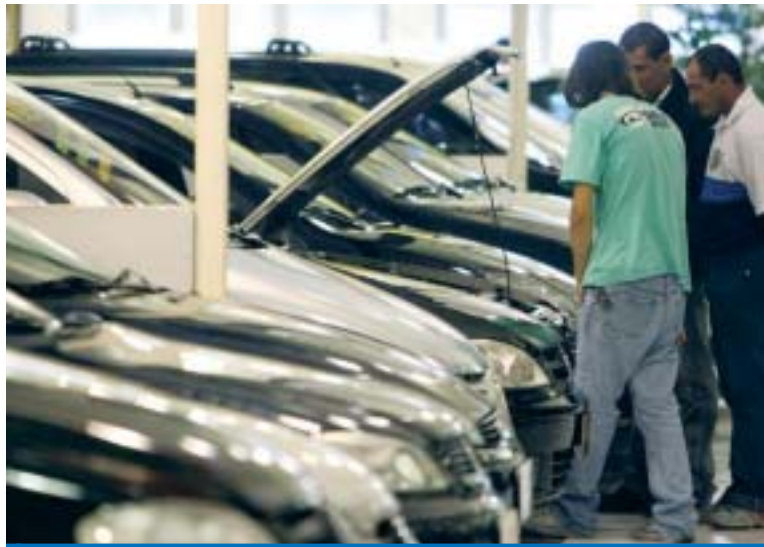
O mercado automobilístico tem sustentado um excelente número de vendas

Segundo empresários, o aumento das vendas em março se deve à procura dos