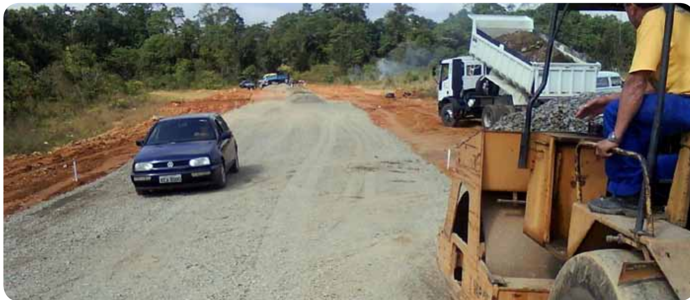
Ensaibramento da rua Átila Urban, via de 600 metros de extensão que liga os bairros Paranaguamirim e Ulisses Guimarães.

A Prefeitura de Joinville investiu R$ 6 milhões no combate às enchentes. Foram limpos mais de 142 km de valas e grandes obras de dragagem nos rios Velho, do Braço, Bucarein, Itaum e Águas Vermelhas. Em saneamento, já começaram as obras do Vila Nova, Saguçu, Espinheiros e vão ser inauguradas as obras do Morro do Amaral.