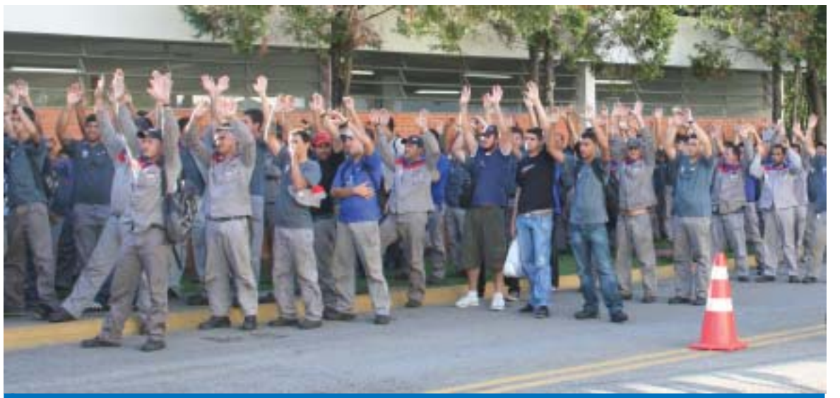
O crescimento apontado no valor da PLR 2010 é resultado da unidade dos trabalhadores na Alstom

Os trabalhadores conquistaram a PLR na Alstom depois de um intenso processo de negociações, que envolveram 6 reuniões