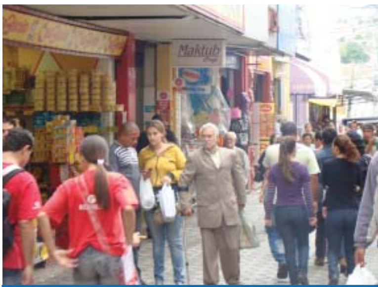
Os trabalhadores metalúrgicos deverão injetar R$ 70 mi, dos 153,2 milhões

O 13º salário dos trabalhadores formais de Taubaté apresenta um acréscimo de cerca de R$ 24 milhões em