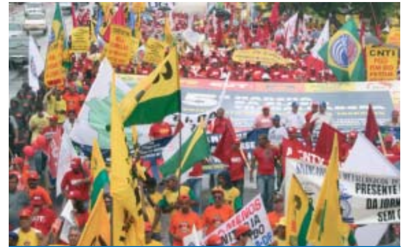
A Classe Trabalhadora mais uma vez estará nas ruas com suas bandeiras de luta

A Central Única dos Trabalhadores (CUT), demais centrais de trabalhadores e movimentos sociais preparam a Jornada Nacional Unificada de Lutas, com manifestações em diversos pontos do país, no dia 14 de agosto.