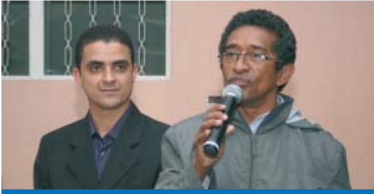
Isaac e o deputado federal Vicente Pinheiro, autor PEC da redução de jornada

A pedido das centrais sindicais, o presidente da Câmara, Michel Temer, estuda a possibilidade de votar, na primeira quinzena de setembro, a Proposta de Emenda Constitucional (PEC) 231/95, de autoria do deputado federal Vicente Pinheiro (PT-SP), que reduz a jornada de trabalho de 44 para 40 horas semanais