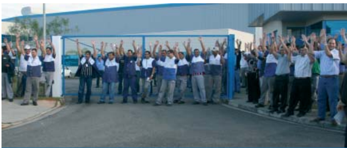
Trabalhadores na Iramec aprovam a PLR 2009 em assembléia realizada na sexta-feira, dia 07

Parabéns aos trabalhadores pela unidade e pela conquista da PLR que contemplou a categoria.