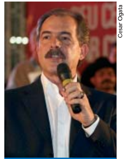
Senador Aloizio Mercadante

preços e a modificação na forma de cobrança dos pedágios nas estradas paulistas também estão entre as propostas de governo de Mercadante.