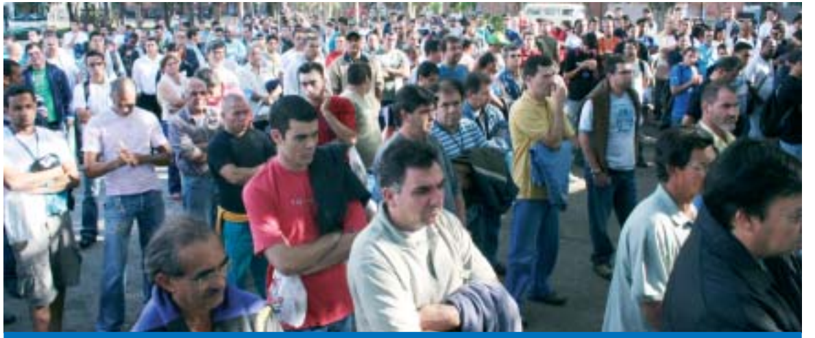
Os acordos foram negociados nas empresas Stell Coat, Quasar, SG, SM, Gestamp, Aethra, Goodyear e Servlog, beneficiando cerca de 1.450 trabalhadores

"Temos a clareza que a PLR é um instrumento de geração de renda para os trabalha-