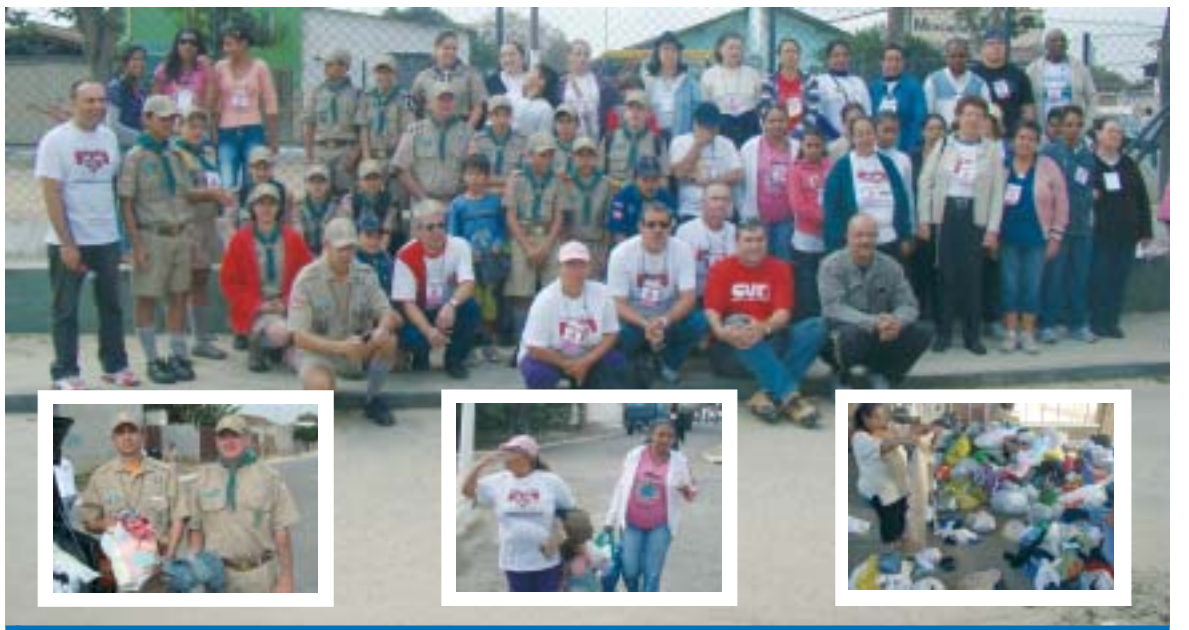
Voluntários fizeram a arrecadação nos principais bairros de Tremembé e tiveram grande número de doações

Tremembé foi uma continuação da bem sucedida Campanha do Agasalho do Sindicato