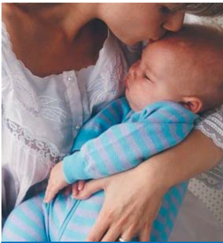
Aprovação garante força para a reivindicação da categoria na Campanha Salarial

De acordo com a Sociedade Brasileira de Pediatria, o Brasil tem um gasto estimado de R$ 300 milhões no atendimento às crianças com doenças que poderiam ser evitadas se elas se alimentassem com leite materno nos seis primeiros meses de vida.