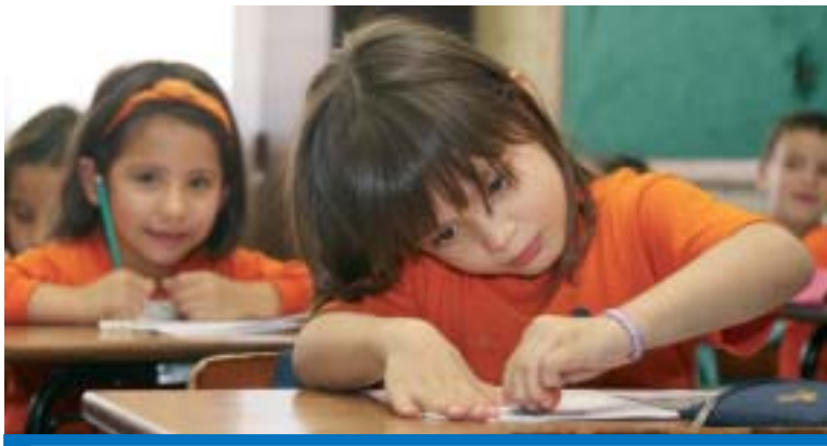
A maioria dos municípios brasileiros atingiram a meta da educação básica

Em 2009, 50,2% das cidades ficaram acima da média nacional, que foi de 4,6 pontos, em uma escala de 0 a 10. Na