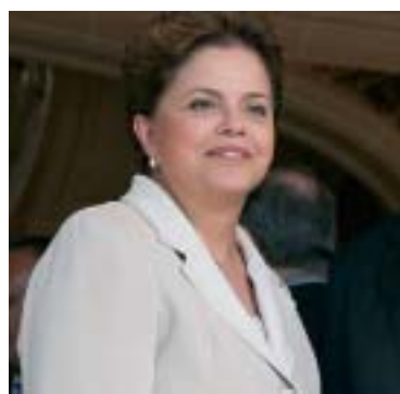
Apoio a Dilma não para de crescer