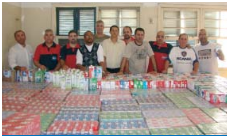
Representantes dos trabalhadores na Volks durante a entrega de leite

Segundo o Comitê Nacional dos Trabalhadores na Volkswagen, foram arrecadados 13 mil litros de leite longa vida em 4 plantas da Volks no Brasil.