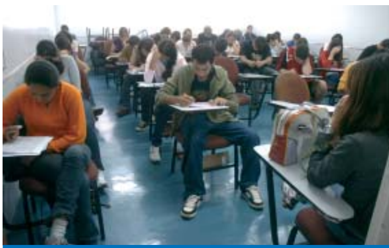
Estudantes fazem as provas do Exame Nacional do Ensino Médio (Enem)

O sistema para inscrição esteve disponível nos últimos 35 dias pela internet, com um total de 6.761.646 acessos. De acordo com o Ministério