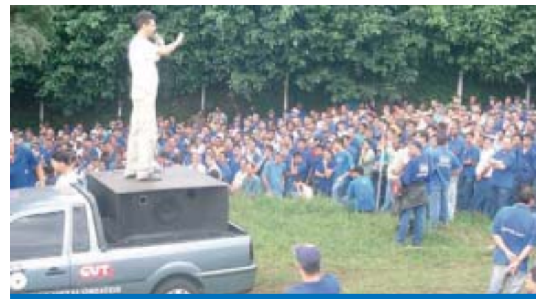
Metalúrgicos de Matão reconhecem o trabalho da CUT pela categoria

Nos dias 16 e 17 de julho aconteceu a eleição da nova diretoria do Sindicato dos Metalúrgicos de Matão.