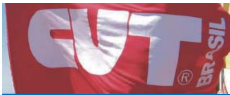
Chapa da CUT venceu com 58% dos votos válidos a eleição dos Servidores

A eleição do Sindicato dos Servidores Municipais de Aparecida foi vencida pela Chapa 1 da CUT com 58% dos votos válidos.