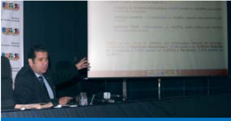
O ministro do Trabalho, Carlos Lupi, apresenta os dados do Caged

Com a abertura de 119.495 empregos formais celetistas em junho, o Brasil fecha o primeiro semestre de 2009 com saldo positivo de 299.506 novos postos de trabalho gerados. Esse resultado constitui o quinto mês consecutivo de expansão e o segundo me-