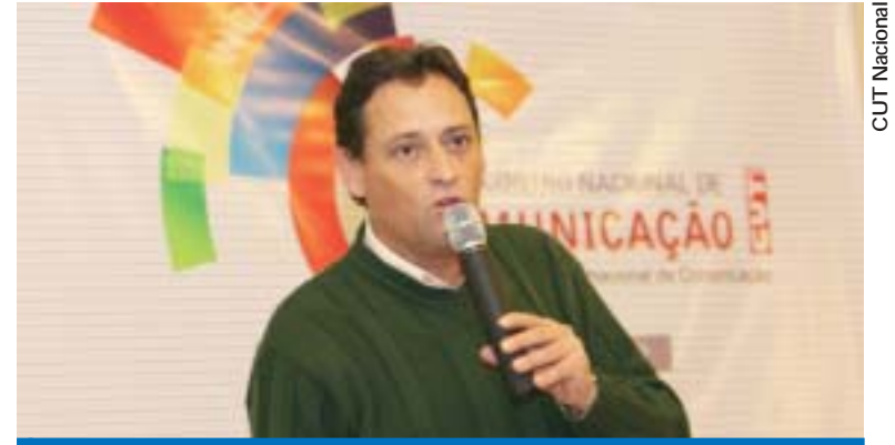
O presidente da CUT, Artur Henrique, durante a abertura do Enecom

A Central Única dos Trabalhadores realizou em São Paulo, de 15 a 17 de julho, o seu 5º Encontro Nacional de Comunicação (ENACOM), com o compromisso da construção de propostas concretas que contribuam para consolidação de políticas públicas de comunicação no Brasil e promovam a for-