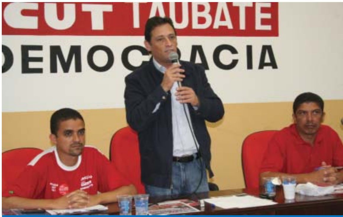
O presidente da CUT Nacional, Artur Henrique, falou sobre as propostas da classe trabalhadora e as Eleições 2008

Os participantes do encontro fizeram uma análise de conjuntura nacional e local sobre as eleições mu-