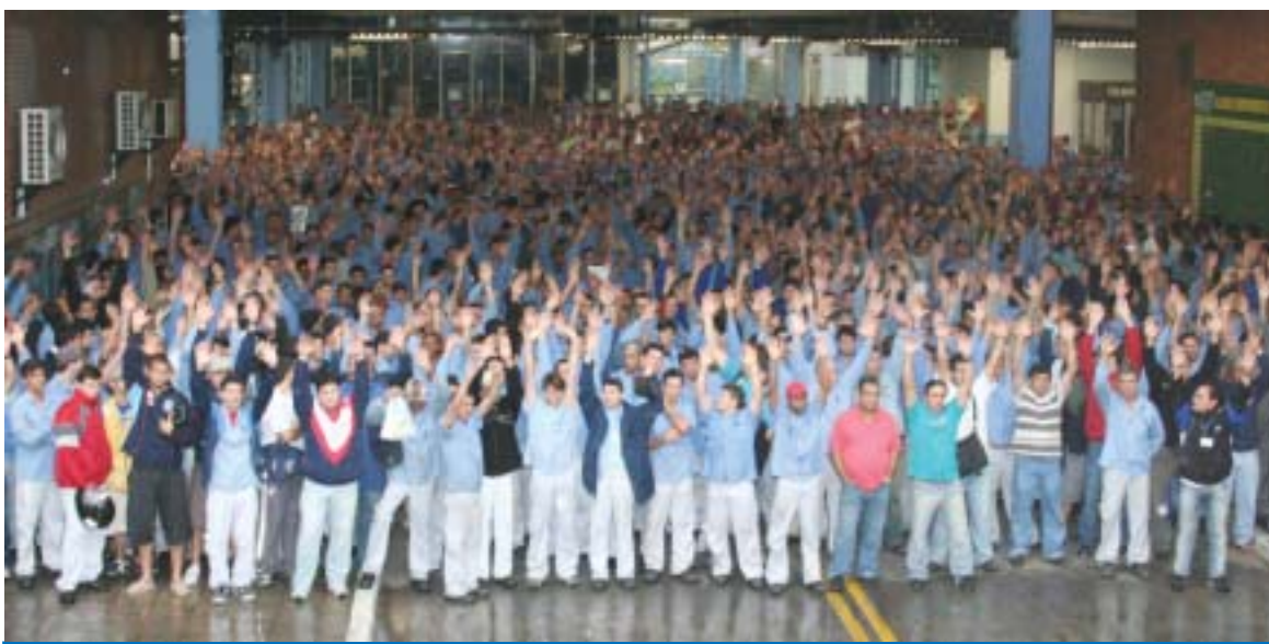
A proposta da PLR 2008 garantiu um aumento de 29% no valor do benefício em relação ao valor pago em 2007

"Temos a certeza que garantimos aos trabalhadores um valor de PLR que está de acordo com a