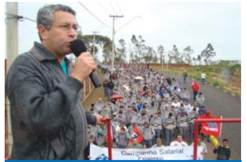
Trabalhadores na Embraer deram uma demonstração de unidade

Os trabalhadores na Embraer Botucatu pararam a produção da empresa por duas horas na manhã desta segunda-feira, 06. A paralisação foi realizada pelo SindiAeroespacial-SP (Sindicato que representa os trabalhadores do setor Aeroespacial). Durante a paralisação os trabalhadores aprovaram estado de greve e também rejeitaram a proposta de reajuste salarial (11,01%) apresentada pela Fiesp no último