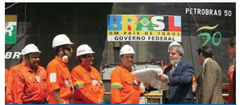
Governo Lula quer atrair novos fabricantes e abrir postos de trabalho no setor

atender a demanda da exploração dos campos de petróleo descobertos na camada do pré-sal. Em Taubaté, a Cameron fabrica esse tipo de equipamento e tem a possibilidade de crescimento neste setor. A iniciativa da Petrobrás vai expandir esse mercado e abrir novos postos de trabalho.