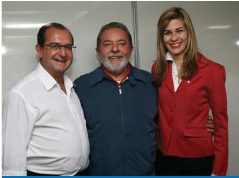
A eleição de Peixoto e Vera Saba marca o fim da era Ortiz em Taubaté e demonstra a força política do presidente Lula na cidade e dos metalúrgicos.

Logo após a vitória, Peixoto disse que será o prefeito