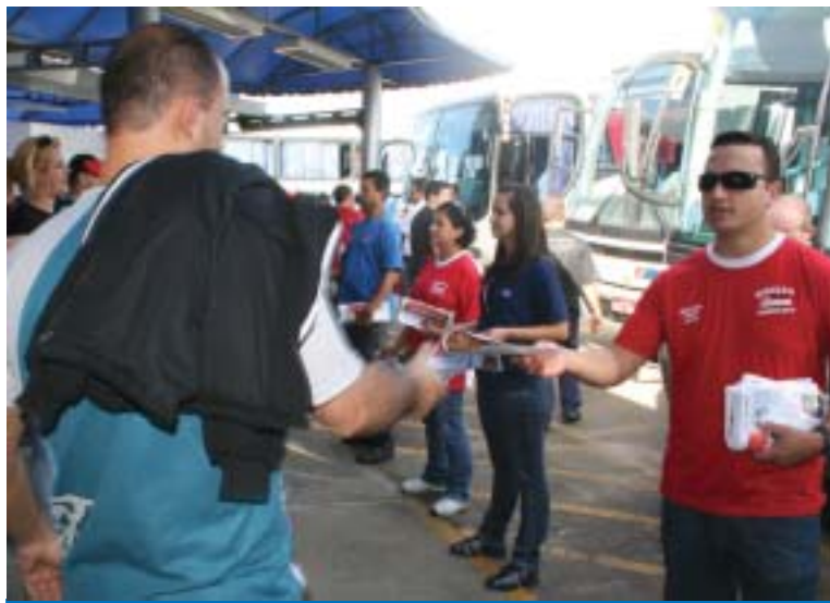
Trabalhadores na GM receberam o jornal da CUT Vale do Paraíba

Os trabalhadores na GM receberam o jornal "CUT Vale" que mostra as conquistas da CUT em seus 25 anos de luta e aborda as principais notícias dos sindicatos filiados à CUT na região. Para o coordenador re-