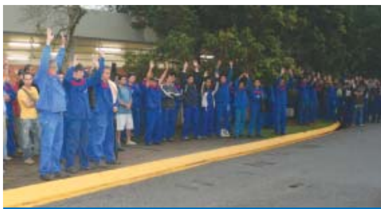
O valor aprovado para a PLR representa um aumento de 35%

Com o resultado da assembléia os trabalhadores na Alstom deram uma demonstração de unidade, de luta e de avanço na conquista dos trabalhadores.