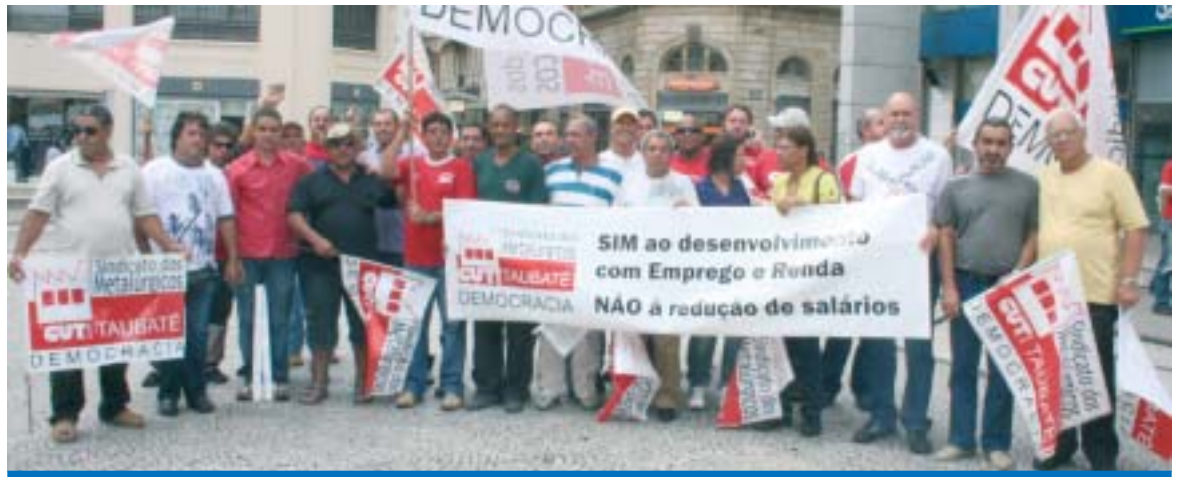
Os metalúrgicos de Taubaté participaram do ato da CUT/SP na praça do Patriarca em São Paulo no dia 11 de fevereiro

"A CUT está no dia de hoje mobilizada em todo o Brasil pela defesa dos salários e