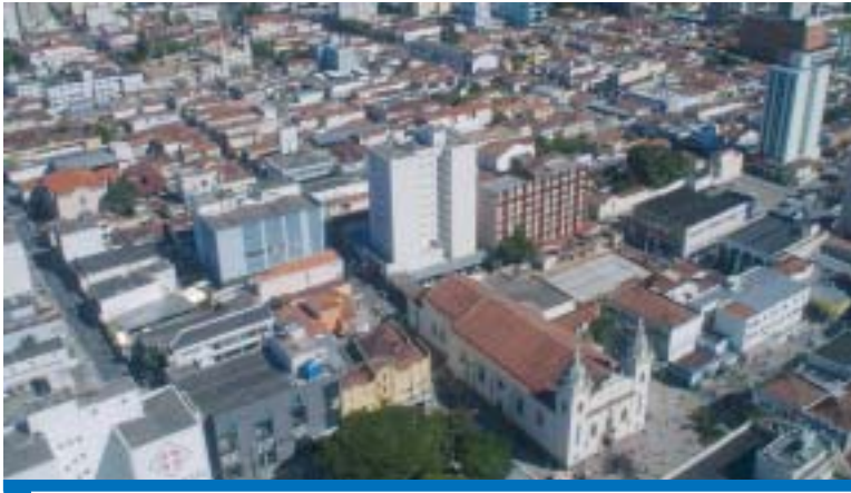
Sindicato e CUT trabalham em Taubaté pela manutenção dos empregos

O balanço mensal do Ciesp (Centro das Indústrias do Estado de São Paulo) apontou no mês de janeiro a sexta redução seguida no nível de emprego na região.