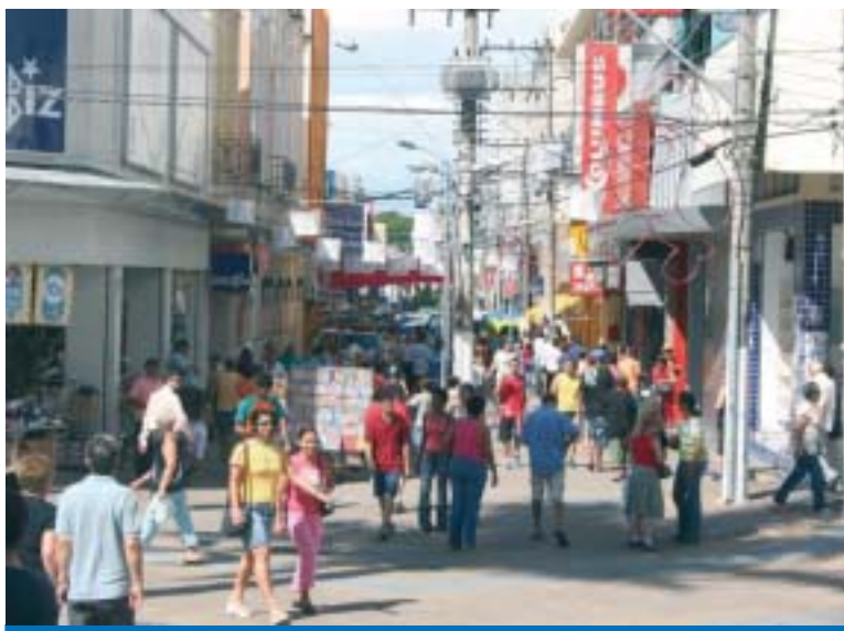
Comércio é um dos beneficiados com a injeção na economia de R$ 9,7 mi

aprovado pelos trabalhadores, a negociação feita pelo Sindicato segue a política da CUT e do Governo Federal, que acreditam no fortalecimento da produção e do consumo como principais ferramentas de combate à crise internacional.