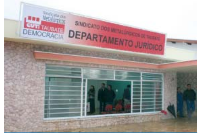
Interessados devem procurar o Departamento Jurídico do Sindicato

O Sindicato informa que os trabalhadores já podem procurar o Departamento Jurídico da entidade para entrar com a ação na Justiça Federal para reaver o Imposto de Renda pago sobre férias vendidas nos últimos 10 anos.