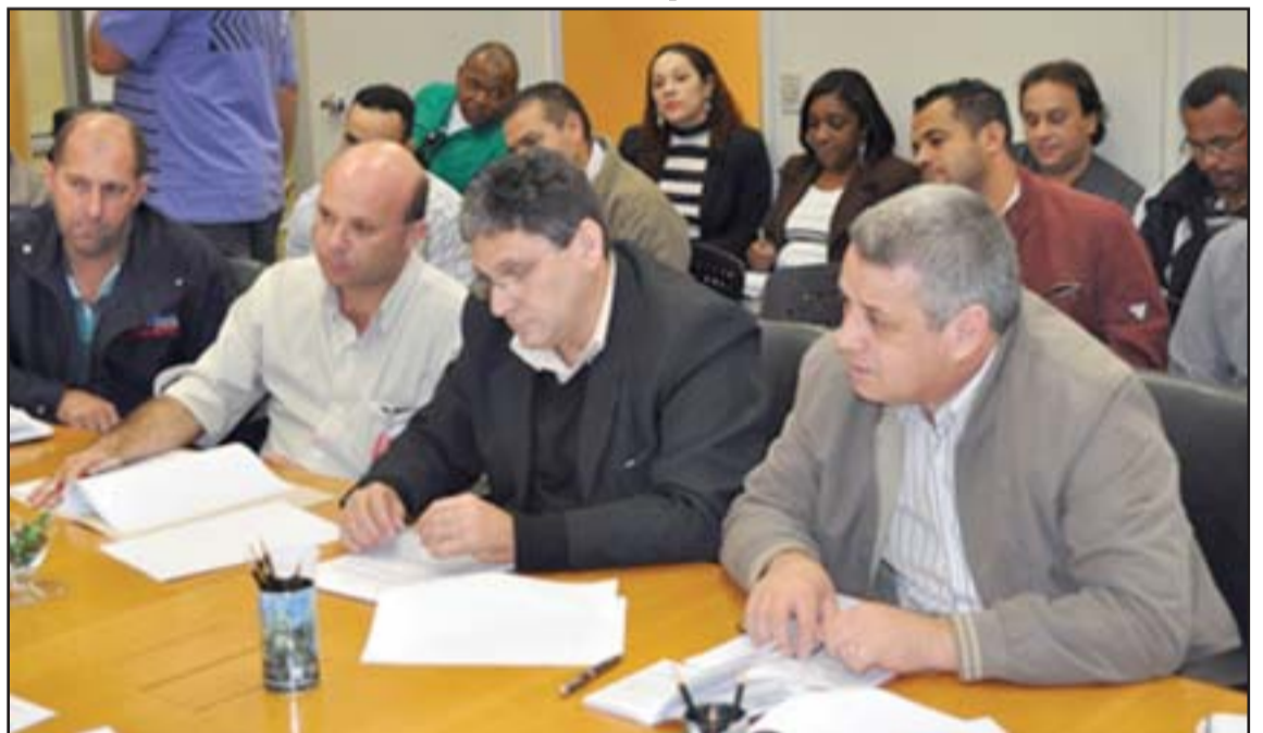
Mesa de negociação no Grupo 3

O Sindipeças, um dos maiores setores dentro do G3, representa 500 empresas associadas em todo o Brasil.