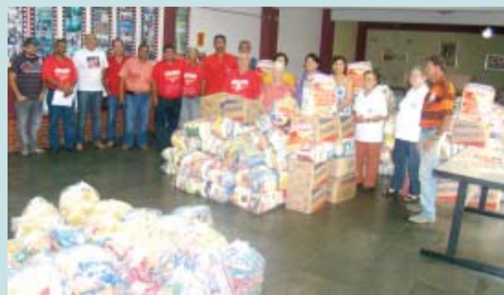
Entrega dos alimentos na Campanha de 2010

Neste ano queremos convidar você, metalúrgicos e metalúrgicas, para ser voluntário (a) nessa empreitada. Venha ser um voluntário (a) junto com as entidades sociais e desenvolver o trabalho de arrecadação de alimentos nas ruas. Será fornecida toda a estrutura necessária para o desenvolvimento das atividades de