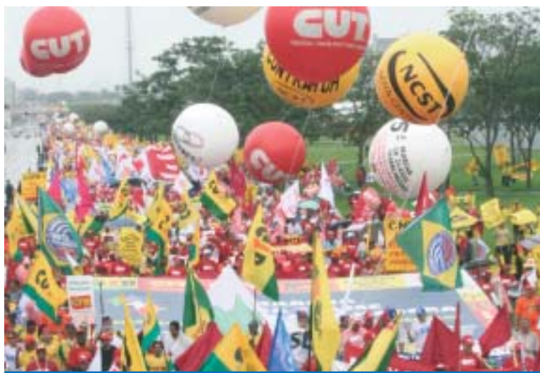
A Classe Trabalhadora estará mais uma vez nas ruas de Brasília

Neste ano a Marcha da Classe Trabalhadora terá os seguintes eixos de luta: