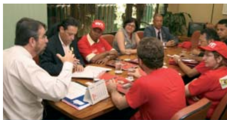
Representantes da CUT estiveram no Congresso Nacional no dia 07

Para a Central Única dos Trabalhadores, este conceito deve se traduzir na ampli-