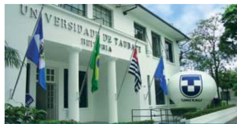
As inscrições para o Vestibular 2010 poderão ser feitas pelo site www.unitau.br

A Universidade de Taubaté (UNITAU) remarcou a prova do Vestibular para o dia 12 de dezembro.