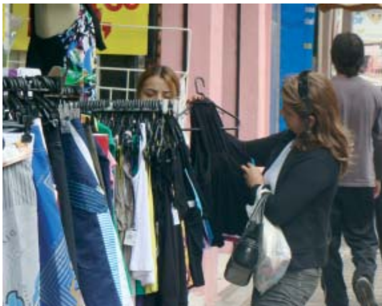
Confecções e magazines devem abrir mais postos de trabalho segundo ACIT

Uma pesquisa realizada pela Associação Comercial e Industrial de Taubaté (ACIT) aponta que 3.700 vagas temporárias devem ser geradas pelos setores de comércio e