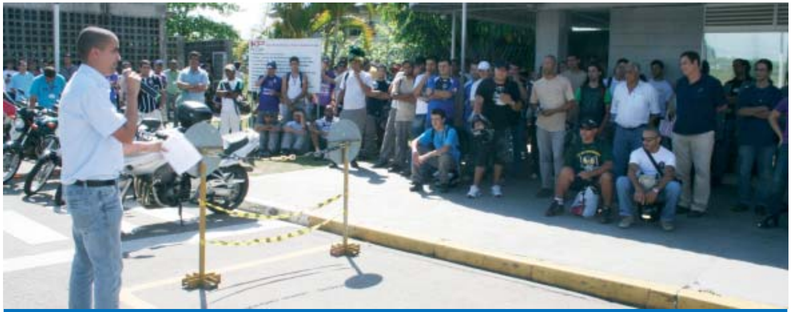
Presidente Isaac conversa em assembleia com os trabalhadores na Pelzer - é hora de unidade e mobilização da categoria pelos empregos

O Sindicato já está mobilizando toda a sociedade civil de Taubaté e região, os