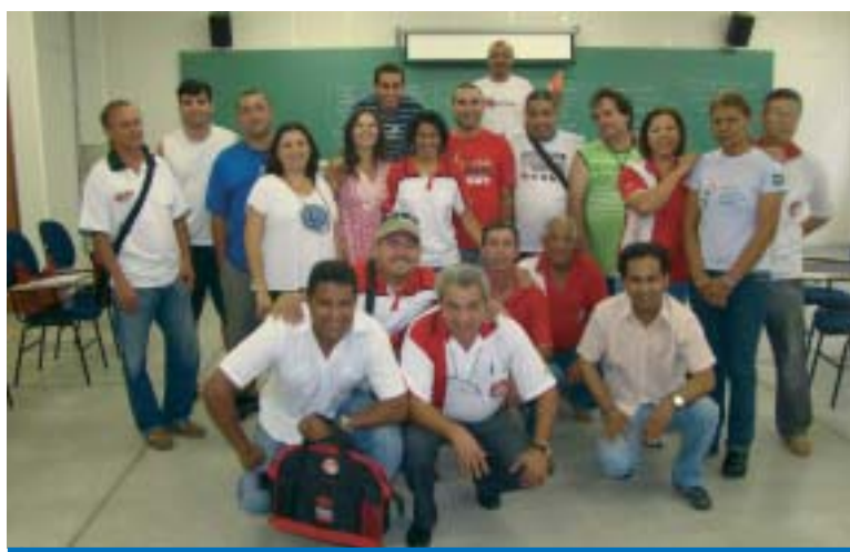
Dirigentes sindicais, Cipeiros e Comissão de Fábrica participam do Curso

O módulo final do curso acontecerá em dezembro.