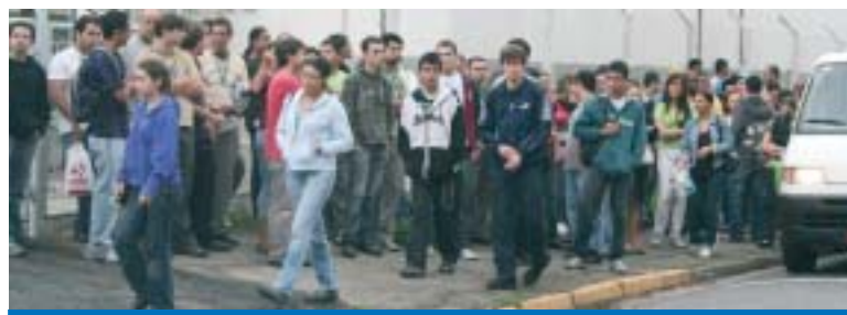
A SIPAT trouxe informações importantes para o dia a dia dos trabalhadores

Aconteceu na última semana a Semana Interna de Prevenção de Acidentes (Sipat) dos trabalhadores na Daruma.