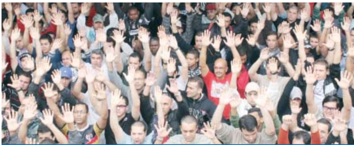
Trabalhadores aprovam a busca do índice de 10% de reajuste na Campanha Salarial 2011 em assembléia no Sindicato

As bancadas patronais do Grupo 2, Grupo 8 e Autopeças cederam à pressão e mobilização dos trabalhadores e chegaram a propostas que contemplaram a reivindicação de reajuste de 10% aprovado pela categoria em assembléia no Sindicato no dia 11 de setembro.