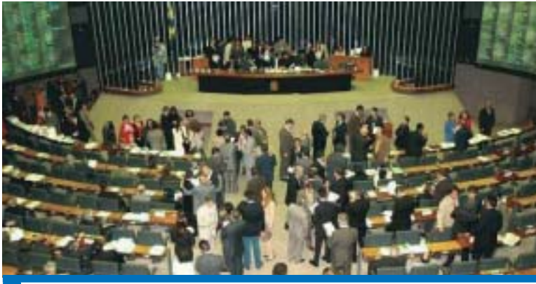
CUT entende que a questão deveria ter sido mais debatida com as centrais

Na última semana, a Câmara dos Deputados aprovou o projeto de lei do Senado que aumenta o tempo de aviso prévio para os trabalhadores com mais de um ano no mesmo emprego.