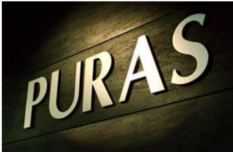
Site oficial Puras Brasil

No restaurante do setor de Laminação da Gerdau, ninguém suporta mais o mau cheiro na porta do estabelecimento, pois há muitos pombos defecando no local. Na mesma unidade da Puras, recebemos a denúncia de que estão estocando carne em freezer não apropriado. A supervisão