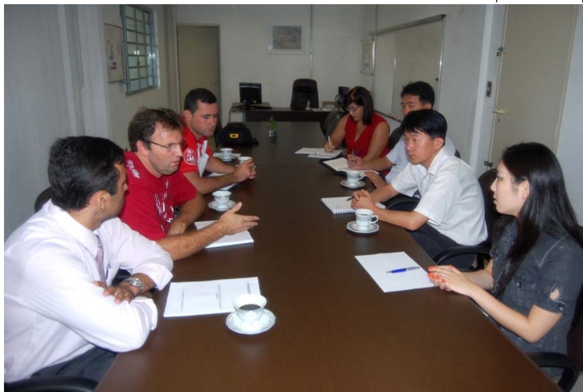
Pág. 4 Presidente Romeu cobra mais diálogo e propôs melhores condições para os trabalhadores

Após ouvir as reclamações que funcionários têm feito ao sindicato, a empresa se mostrou aberta ao diálogo e pediu ajuda do sindicato e dos trabalhadores para solução dos problemas.