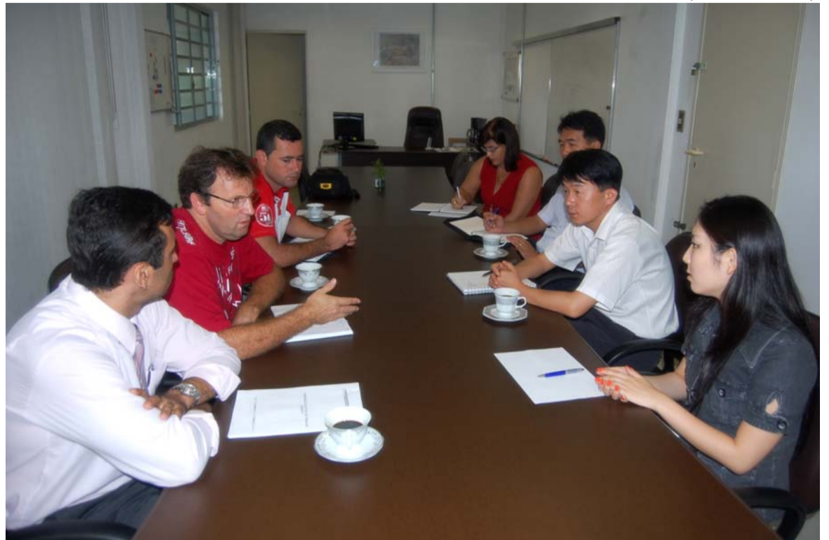
Presidente Romeu cobra mais diálogo e propôs melhores condições para os trabalhadores

A conversa esquentou quando o assunto na Cipa foi posto à mesa. A direção da Dongwoo chegou a afirmar que a Cipa ‘gera despesa’ para a fábrica,