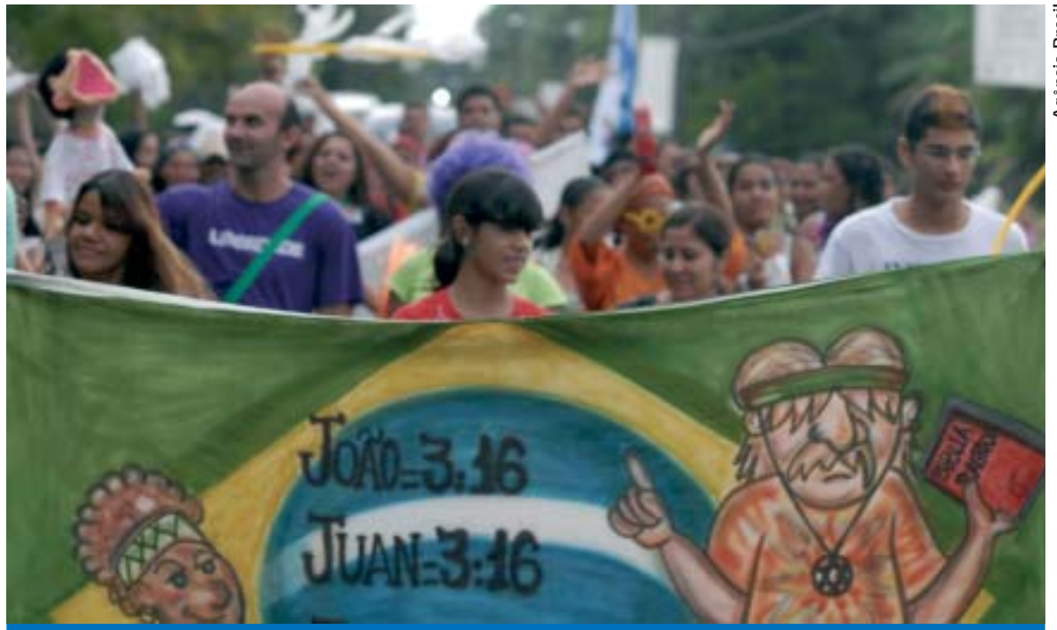
Participantes do Fórum Social Mundial 2009 saem às ruas da capital do Pará, sede do evento

A CUT participará ativamente deste Fórum Social Mundial e entende que este evento será histórico para o debate sobre o desenvolvi-