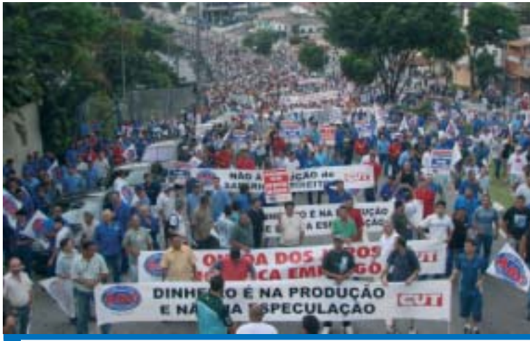
Pressão dos trabalhadores contribuiu para a redução da taxa de juros

"Esperamos que isso represente o início de um processo duradouro, pois a re-