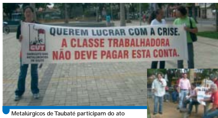
Metalúrgicos de Taubaté participam do ato

O ato fez parte da agenda de mobilizações da CUT em defesa dos trabalhadores contra os ataques promovidos pelos patrões que pre-