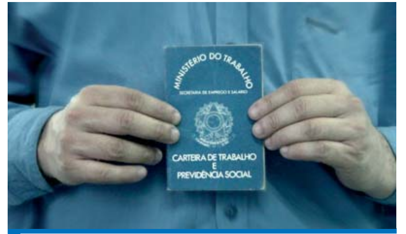
Apesar da crise, o país tem condições de manter o nível dos empregos

A taxa de desemprego média no Brasil em 2008 ficou em 7,9%, contra 9,3% em 2007, segundo dados divulgados pelo IBGE. O dado divulgado é o menor da série iniciada em 2002.