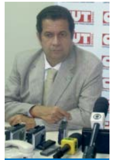
Ministro Carlos Lupi

O presidente da CUT, Artur Henrique, falou da satisfação "de ter no ministro um parceiro das propostas que nossa Central tem defendido junto ao governo e aos empresários. São propostas