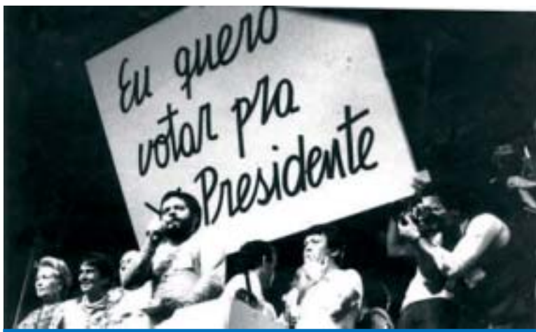
Lula, então presidente do PT, discursando no histórico comício das Diretas Já

Em 1989 o povo voltaria a eleger pelo voto Direto o presidente da República, co-