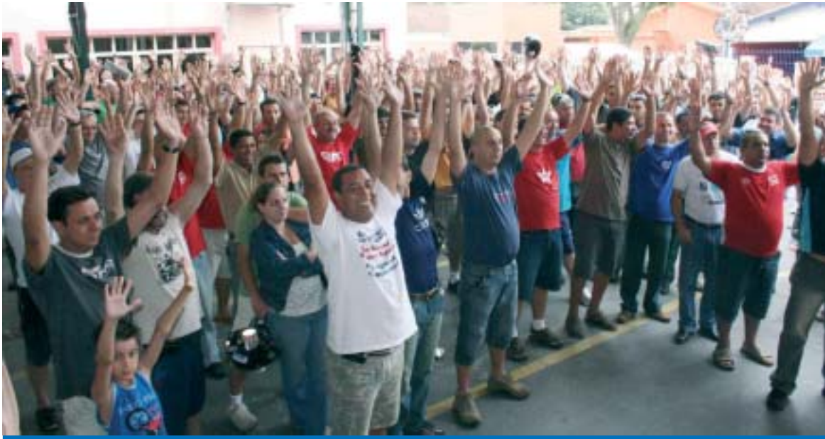
Campanha Salarial 2009 vai exigir muita unidade e disposição de luta dos trabalhadores e trabalhadoras

No próximo sábado, dia 6, a partir das 10h, acontece a Plenária Regional da FEM/CUT-SP da Campanha Salarial 2009 em Taubaté, na sede do Sindicato.