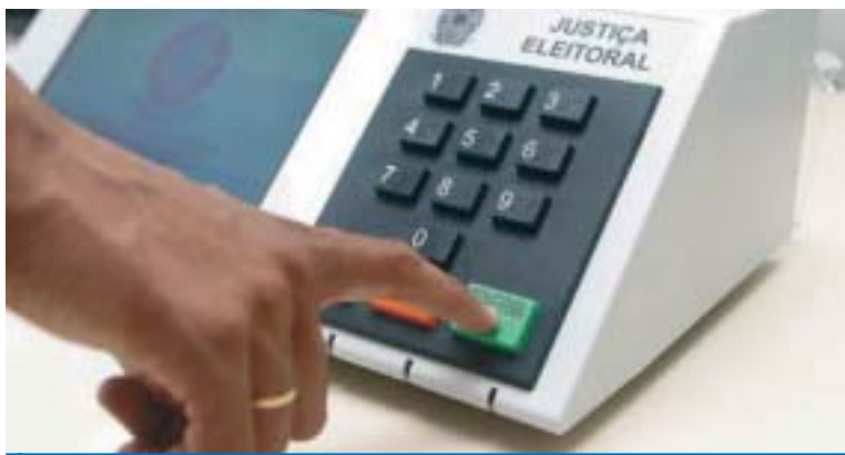
Não deixe de comparecer às urnas neste domingo e votar pelo Brasil

É hora de comparecer às urnas e votar nos candidatos que tem compromisso com a Classe Trabalhadora e suas pautas de reivindicação, como a redução da jornada de trabalho para 40 horas semanais e a geração