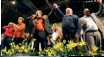
Lula e os candidatos do campo democrático popular no último comício em São Paulo