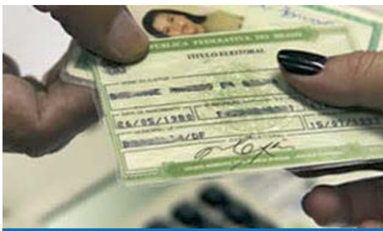
Eleitor deve levar o Título e um documento com foto para a votação

Valem como documento adicional a carteira de iden-