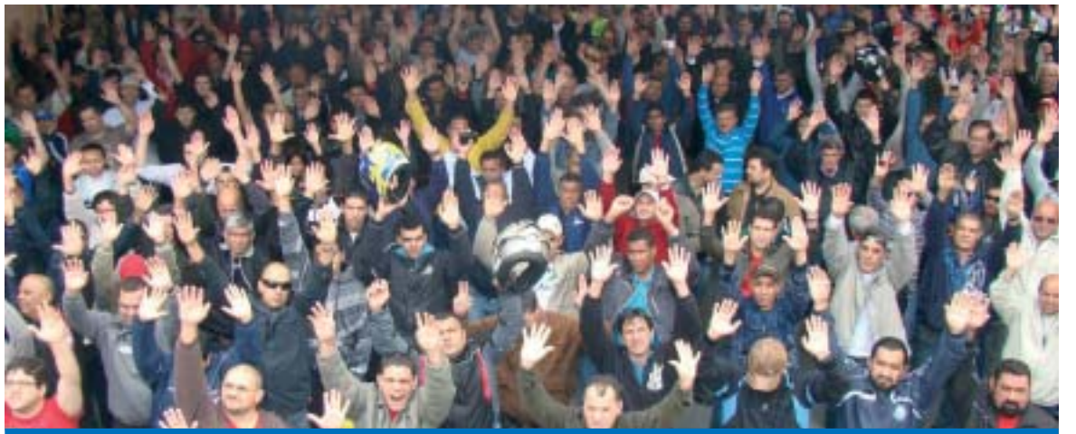
Metalúrgicos de Taubaté injetam mais de R$ 100 milhões na região nos próximos 12 meses com acordos aprovados

Com relação ao Estado, o DII-EESE calcula que R$ 837,4 milhões serão injetados na