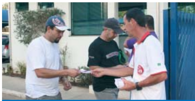
Convenção coletiva do Grupo 8 é entregue aos trabalhadores na Feeling

O Sindicato está realizando a entrega das Convenções Coletivas para os trabalhadores nas empresas do Grupo 2 (máquinas e eletrônicos), Grupo 8 (trifilação e