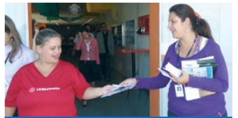
Trabalhadora recebe convenção coletiva do Grupo 2 na LG Electronics

As edições de bolso das Convenções Coletivas são editadas pela FEM/CUT-SP (Federação Estadual dos Me-