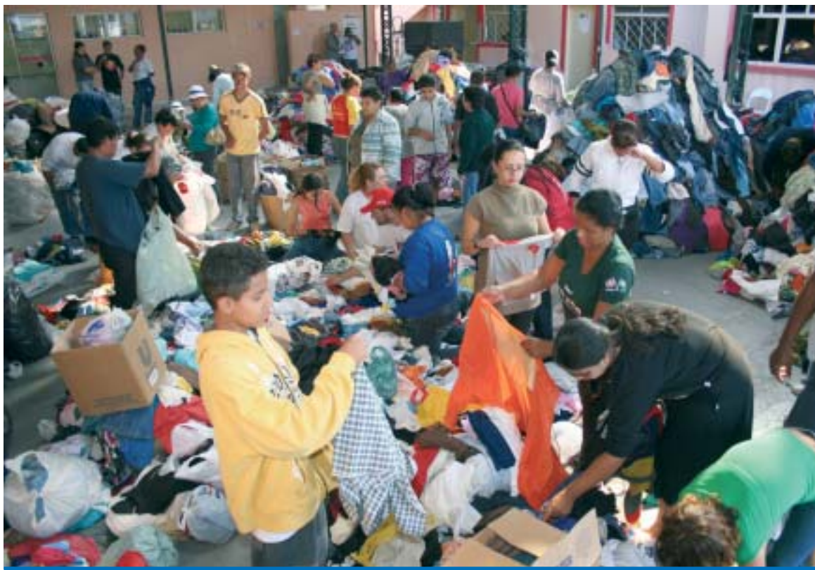
Voluntários fazem a separação das roupas, agasalhos e cobertores arrecadados no domingo, dia 27, nas ruas da cidade