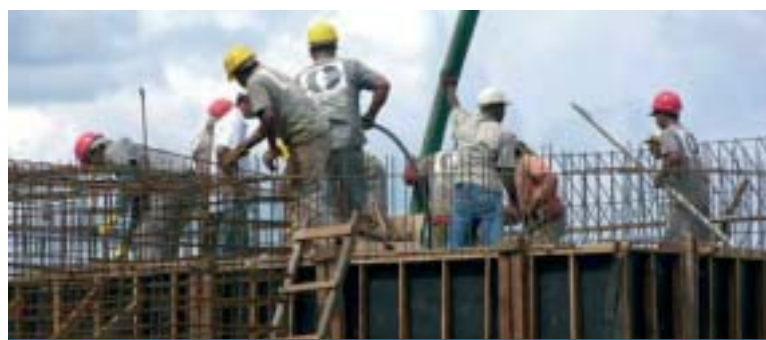
Copa do Mundo e Jogos Olímpicos receberão grandes investimentos

Os investimentos internos em infraestrutura e na construção civil, entre este ano e 2013, deverão somar US$ 735 bilhões, disse o ministro do Desenvolvimento, Miguel Jorge, citando levantamento do BNDES em discurso durante o seminário Brasil-Itá-