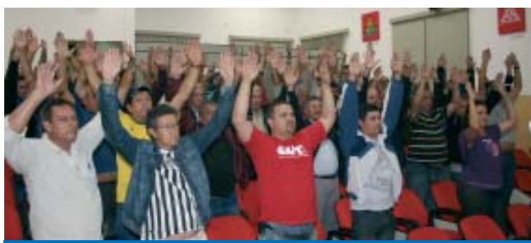
Assimbleia aprova a prestação de contas do Sindicato e o orçamento de 2011

Esta foi mais uma demonstração de seriedade e compromisso da Direção do Sindicato com o patrimônio dos trabalhadores, tratando com transparência a administração da entidade que é mantida com a colaboração e unidade dos sócios por um Sindicato forte e de luta.