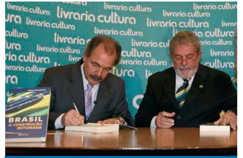
Livro de Mercadante narra a retomada do crescimento do país com Lula

Com a presença do presidente Lula, o senador Aloizio Mercadante lançou no dia 29 o livro Brasil - a Construção Retomada , em evento que aconteceu na Livraria Cultura em São Paulo.