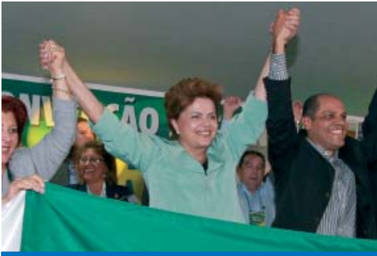
A petista Dilma Rousseff assume a liderança na corrida presidencial

Pesquisa Vox Populi divulgada no dia 29 confirmou a vantagem da petista Dilma Rousseff sobre o tucano José Serra por 40% a 35% das intenções de votos na disputa