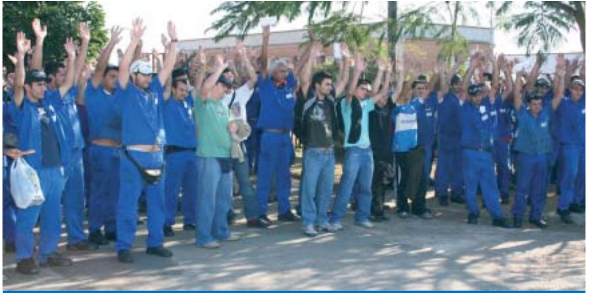
A proposta aprovada é uma conquista, pois ela contemplou a reivindicação dos trabalhadores em relação à 1ª parcela

"A organização dos trabalhadores tem sido fundamen-