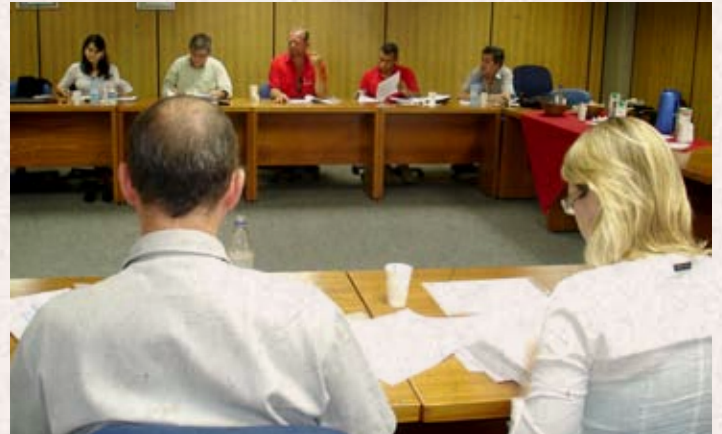
Dia 07/10/2008. Depois de passar cinco reuniões negando as reivindicações, a CST fez uma proposta que não agradou.

O capitalismo se renova a cada dia para acumular sempre. Porém, quando se trata de dividir, o sistema é arcaico e inflexível