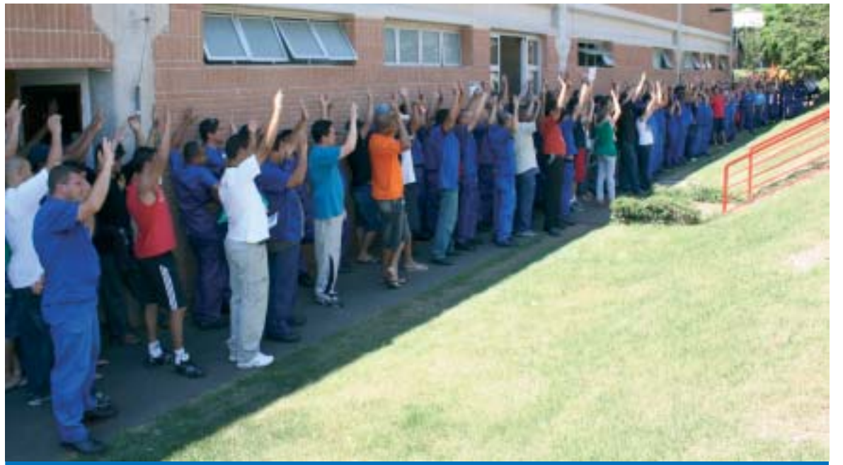
Trabalhadores aprovam a PLR 2008 na Autometal, em assembleia realizada na terça-feira, dia 9 de dezembro

Em 2007, as negociações de PLR injetaram R$ 56 milhões