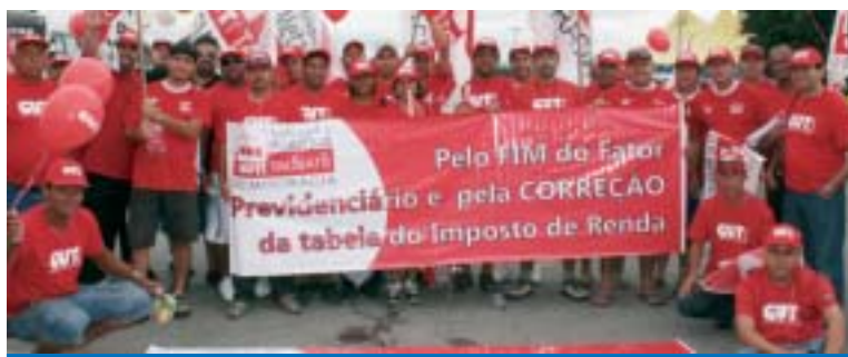
Quem Luta conquista! Depois de 5 marchas a Brasília, Governo corrige a tabela

A correção da tabela do Imposto de Renda atende a uma reivindicação histórica dos trabalhadores, e foi pauta nas 5 marchas que foram realizadas em Brasília pela CUT.