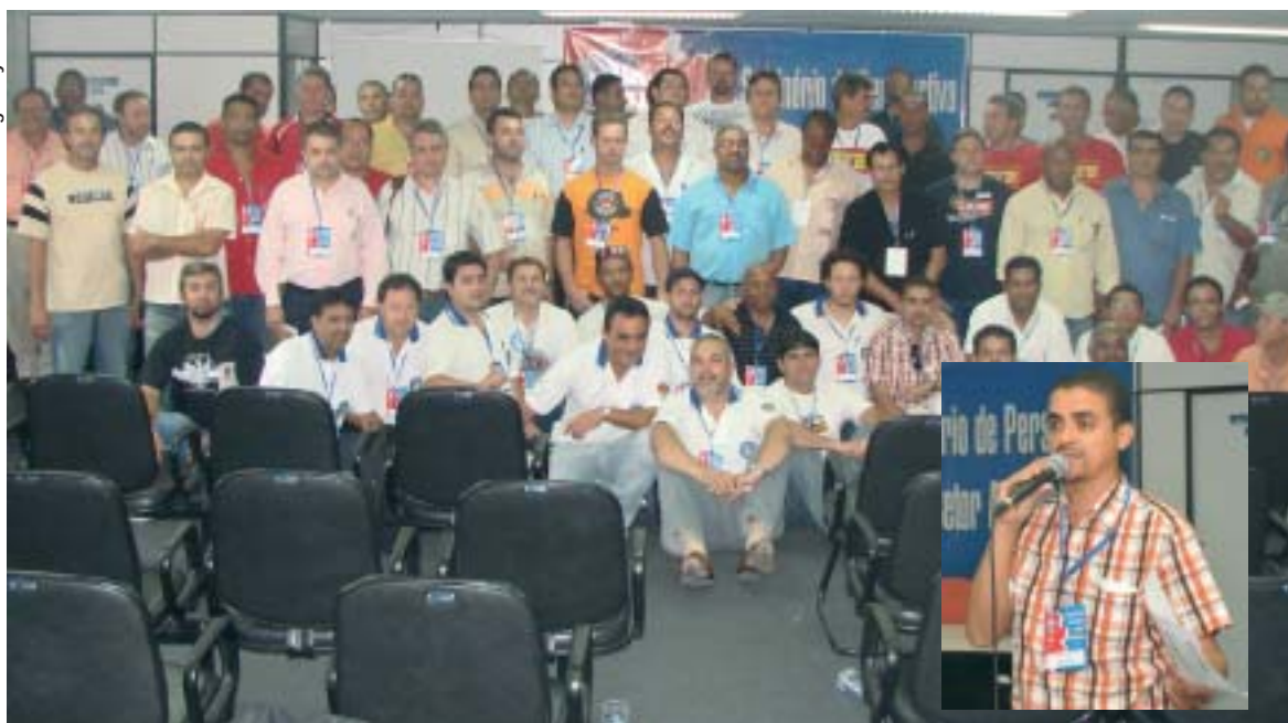
O presidente Isaac (no destaque) fala no seminário que definiu a elaboração de uma agenda de manifestações e debates

Metalúrgicos da CNM/CUT, da CTB e da CNTM (Força Sindical) estiveram reunidos na quarta-feira, dia 10, na sede do Sindicato dos Metalúrgicos de São Paulo para debater a crise financeira e o setor automobilístico.