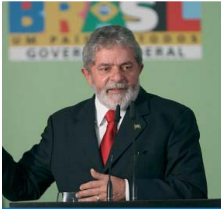
Lula apresenta as medidas de combate à crise financeira internacional

A mudança na tabela do IR deixará mais R$ 4,9 bilhões no bolso dos contri-