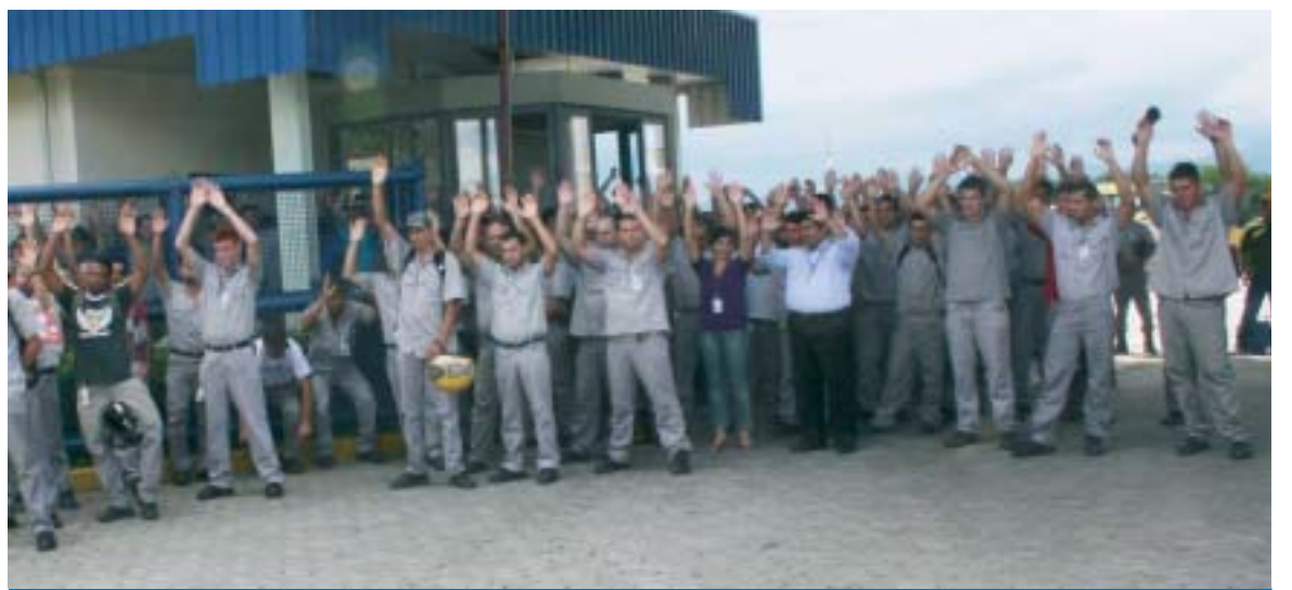
Trabalhadores na Rio Negro aprovam o acordo que garante a manutenção do nível de emprego por 90 dias

"Nos próximos 90 dias teremos condições de tranquilizar os trabalhadores frente