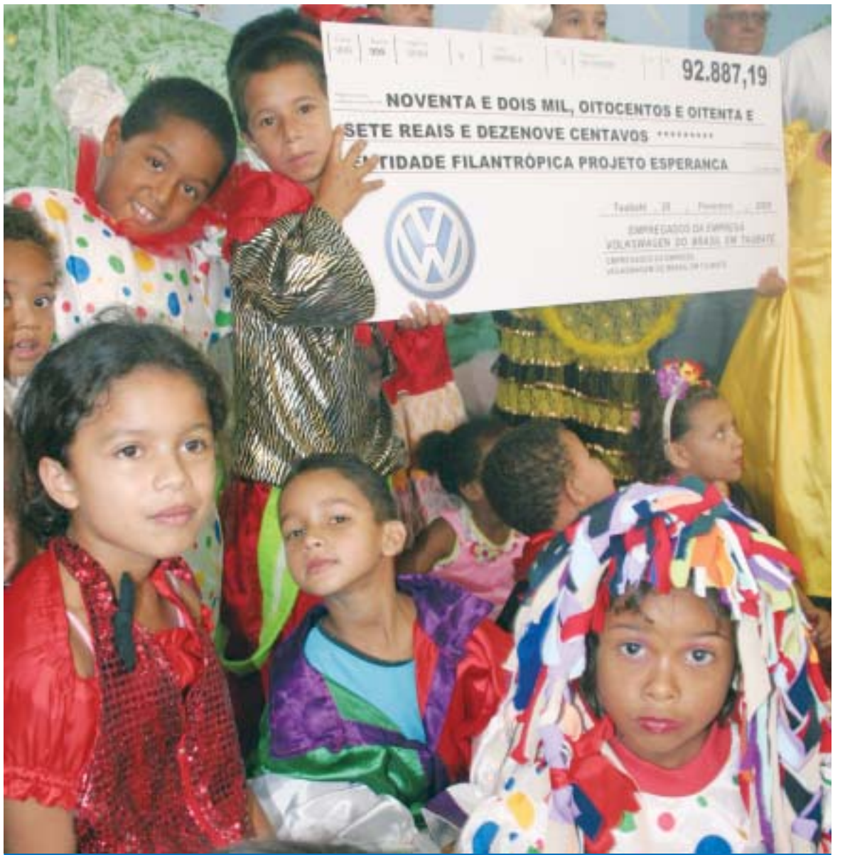
Crianças do Projeto Esperança recebem o cheque com a doação dos trabalhadores na Volkswagen de Taubaté