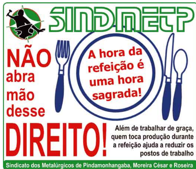
Campanha da Sindicato para conscientizar a categoria sobre a importância do horário de refeição

A paralisação também teve apoio de todos os trabalhadores, que pararam na portaria em >>