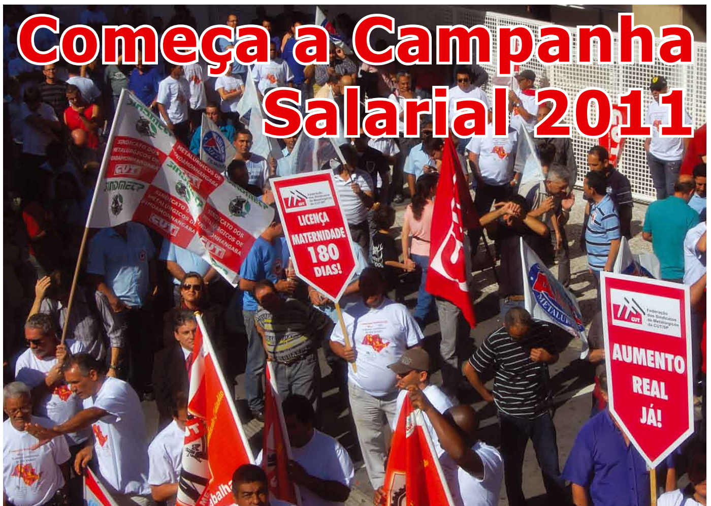
Metalúrgicos dos 14 sindicatos filiados à FEM-CUT/SP, inclusive Pinda, entregam pauta da campanha salarial, em frente à Fiesp, em julho; veja andamento das primeiras negociações

Grupo de oração Missão Santidade ao Senhor a partir das 19h na sede do Sindicato