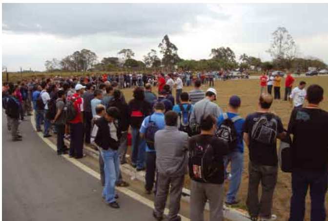
Mobilização dos trabalhadores contra a postura da empresa ficará marcada na história da Gerdau; Sindicato inicia campanha de conscientização, para que o horário de refeição seja respeitado

Greve setORIZADA reverte demissões na Gerdau