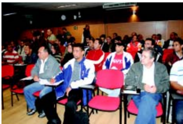
Diretores durante a plenária

Aproximadamente 150 dirigentes dos 14 sindicatos metalúrgicos filiados à FEM-CUT/SP no Estado de São Paulo aprovaram na quarta, dia 13 de junho, durante Plenária Estatutária da Campanha Salarial da Federação as principais reivindicações e o calendário de assembleias. A data-base do ramo metalúrgico cutista é 1º de setembro e estarão em Campanha cerca de 200 mil trabalhadores em todo o Estado. A Plenária aconteceu na sede da FEM-CNM/CUT, em São Bernardo.