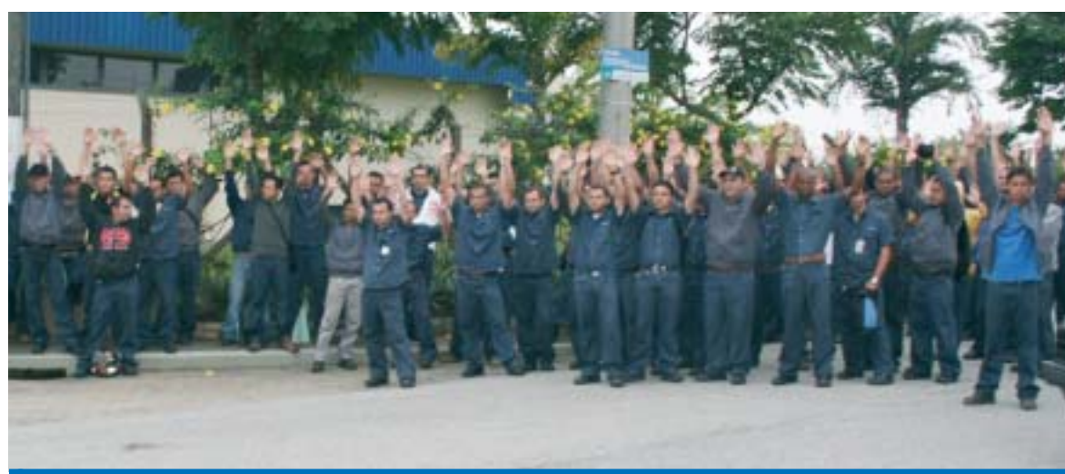
Os trabalhadores estão unidos e mobilizados nessa luta e não aguentam mais posturas arbitrárias da empresa

A empresa alega que houve queda na receita líquida e em função disso não pagou o valor total da 2ª par-