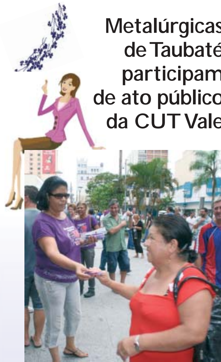
A população de Taubaté participou do ato público da CUT

A Secretaria da Mulher do Sindicato participou na sexta-feira, dia 05, do ato público da CUT Vale do Paraíba em comemoração ao Dia Internacional da Mulher.