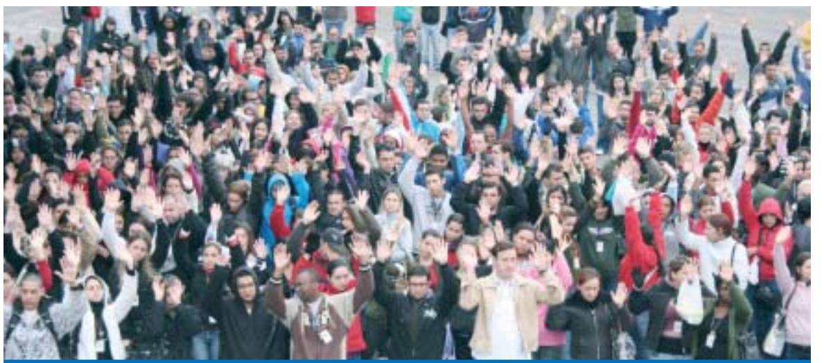
Os trabalhadores na LG também aprovaram a proposta de compensação dos jogos do Brasil na Copa do Mundo

"Além disso, a proposta segue a política do Sindicato