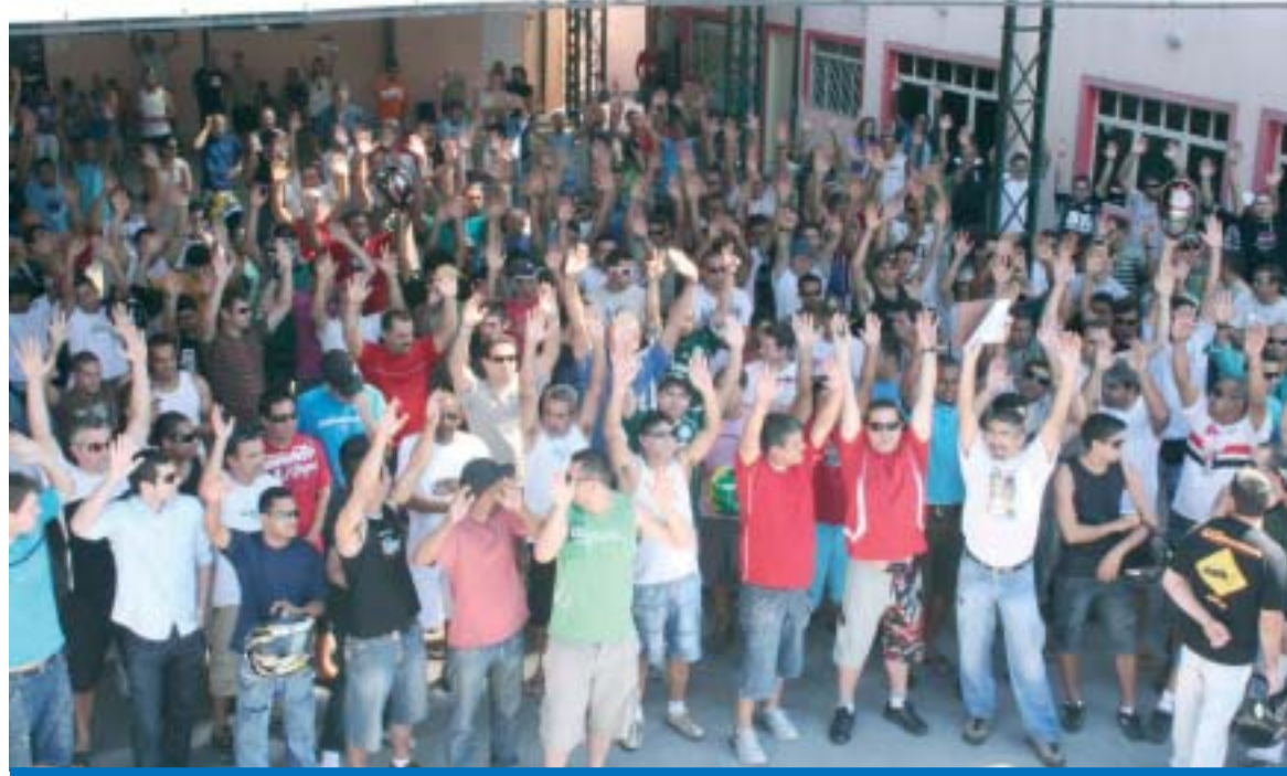
Os Metalúrgicos de Taubaté vão lotar a sede do Sindicato e iniciar mais uma luta pela Campanha Salarial