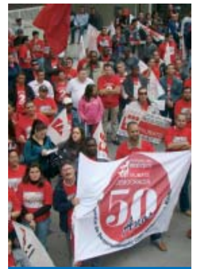
Ato de 2009 em frente à FIESP

É hora de muita unidade e mobilização de todos os trabalhadores (as).