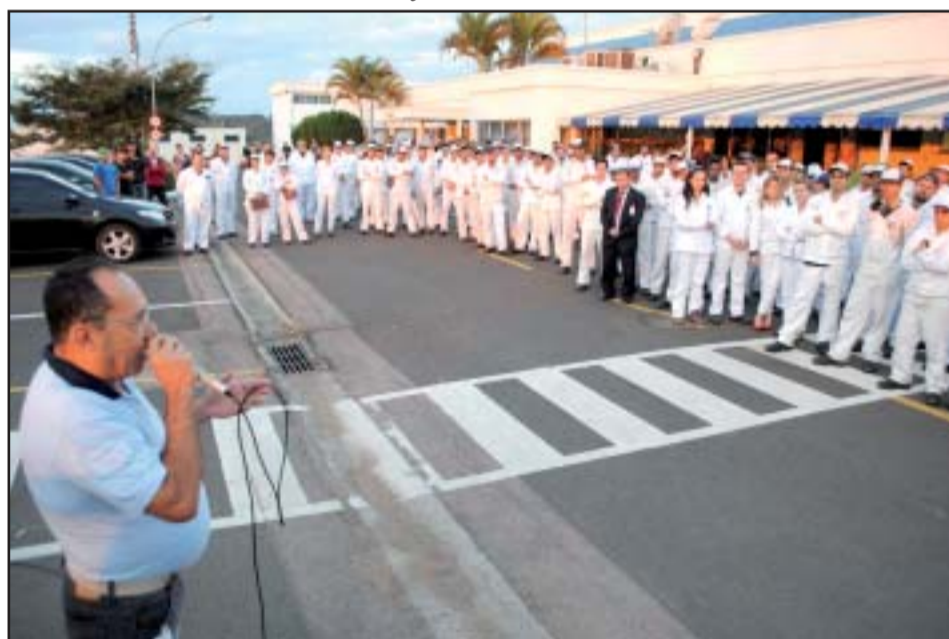
GK - T Brasil