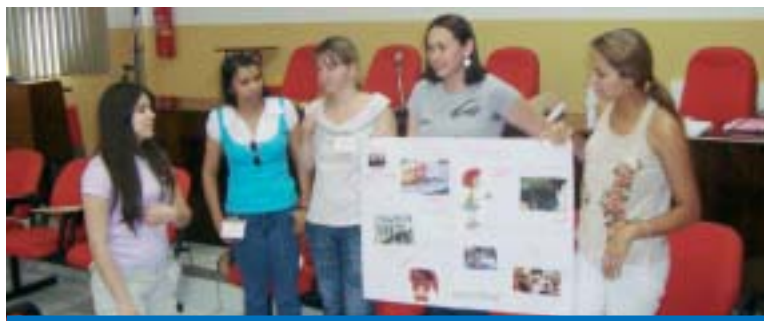
Participantes durante atividade do curso realizado na sede do Sindicato

No dia 14 aconteceu na sede do Sindicato o curso Organização sindical e políticas para juventude, como parte do projeto de intercâmbio entre a CUT/SP e a central sueca LO.