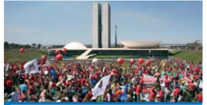
Mais uma vez a classe trabalhadora vai a Brasília lutar pelas suas bandeiras

A CUT e as centrais sindicais realizam a 5ª Marcha da Classe Trabalhadora em Brasília no dia 3 de dezembro.