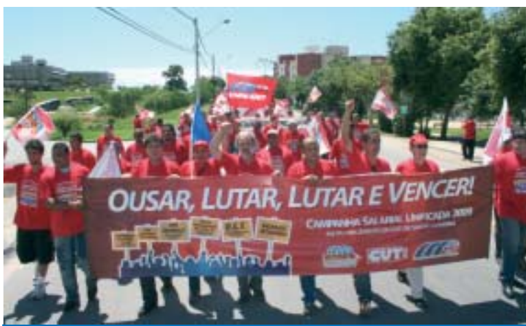
Mais uma vez os metalúrgicos da CUT demonstram sua unidade na luta

Entre os principais pontos da pauta estão a redução da jornada sem redução de salários; a unificação nacional das datas base para setembro; o fim da precarização nos locais de trabalho; realização de acordo no Estado de Santa Catarina para garantir maior segurança nas prensas e similares e a ne-