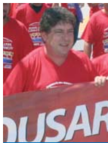
Presidente Grana, da CNM/CUT