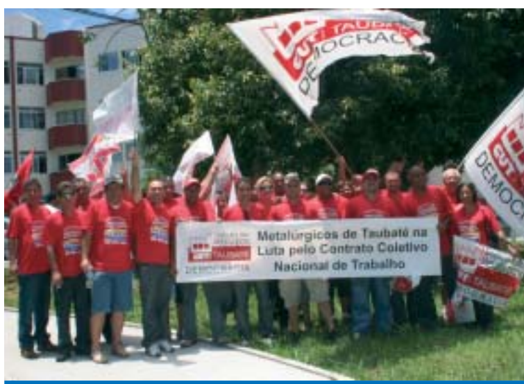
Companheiros dos CSEs de Taubaté e Aposentados marcaram presença

gociação e implementação do Piso Nacional dos Trabalhadores Metalúrgicos do Estado de Santa Catarina.