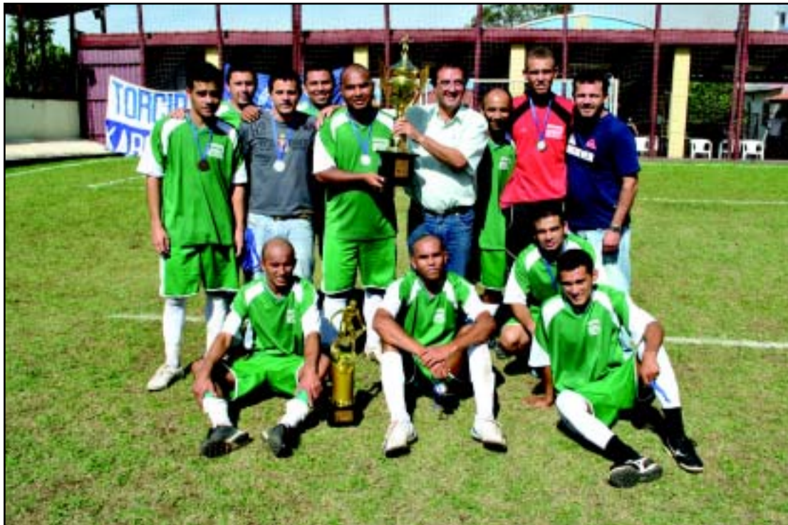
Equipe Plastiron – Vice Campeã