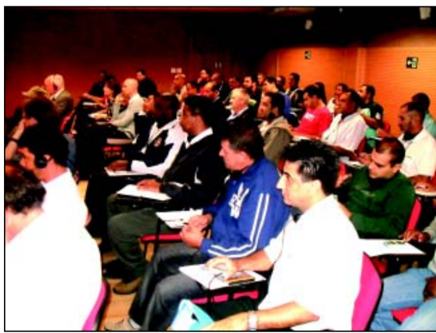
Plenária do encontro com o presidente da FITIM

Durante a participação dos representantes sindicais bra-