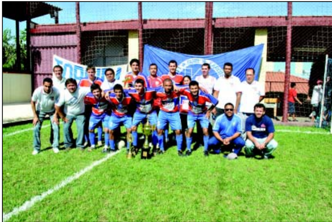
Equipe Karosso – Campeã

A direção do Sindicato dos Metalúrgicos de Itu e Região parabeniza todas as equipes que participaram desse campeonato.