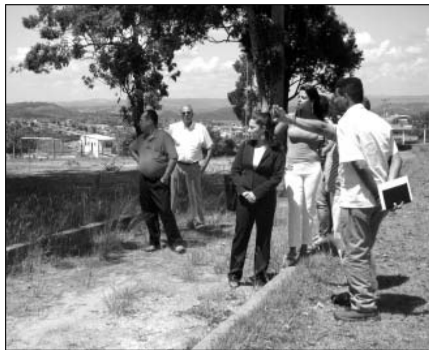
Diretores do SMI com equipe da CUT especionando o local