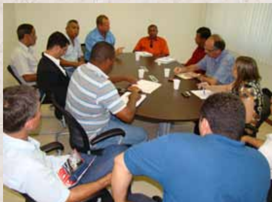
Sindimetal e Siemens em negociação no Sindifer

Como o trabalhador é o termômetro da empresa, a situação na Siemens não estava muito boa para os patrões. Depois que os funcionários resolveram fazer um protesto contra a empresa, o problema por lá começou a ser resolvido, solicitando uma reunião com o Sindicato.