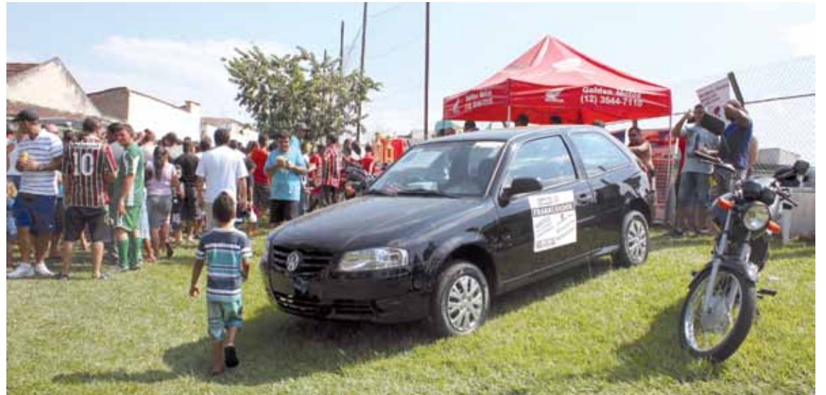
Sindicato sorteou carro, motos, aparelhos de DVD, bicicletas e brindes

Brinquedos para as crianças e monitores ficaram disponíveis durante todo o dia.