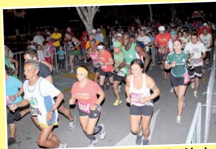
130 atletas participaram da Corrida da Liberdade, que deu premiações em brindes e dinheiro, além de medalhas e lanche a todos os corredores