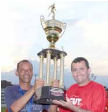
O capitão da Socotherm levanta o troféu de 2º lugar