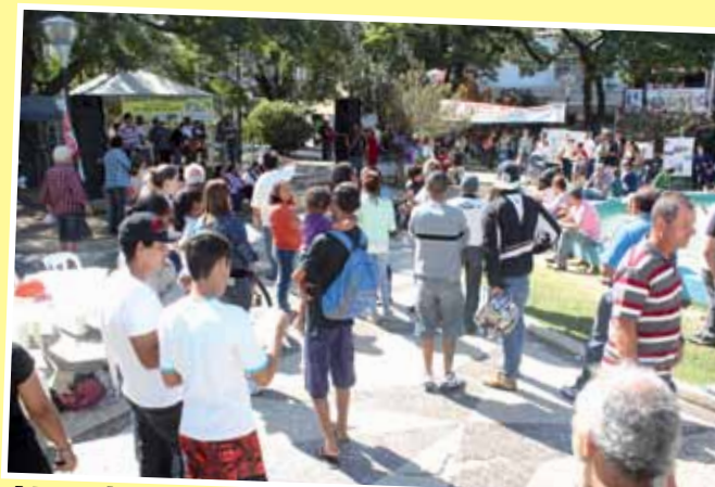
Ato público contou com grupo de pagode Nota Samba, grupo de rap Primeiro Time, além de artesanato africano