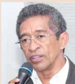
Vicentinho do PT, deputado federal e metalúrgico

"Criança não nasce com preconceito, mas cresce imaginando que a cor da pele negra é inferior. Isso é resquício da escravidão, mas também tem muita gente desejando que continue assim, porque assim é mais fácil manipular, mais fácil de enganar, e é por isso que tem essa luta intensa do movimento negro, dos movimentos sindicais e das igrejas."