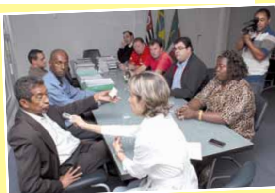
Deputado Federal Vicentinho do PT fez questão de participar e veio mesmo com agenda apertada