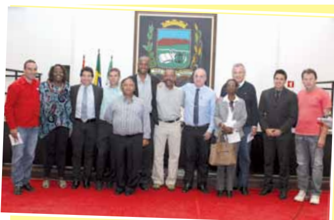
Aprovação do projeto de Lei instituindo a Semana da Liberdade fechou evento com chave de ouro