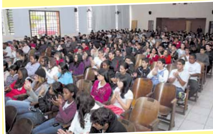
Palestras foram realizadas na ETEC, no Salesianos e na Faculdade Anhanguera