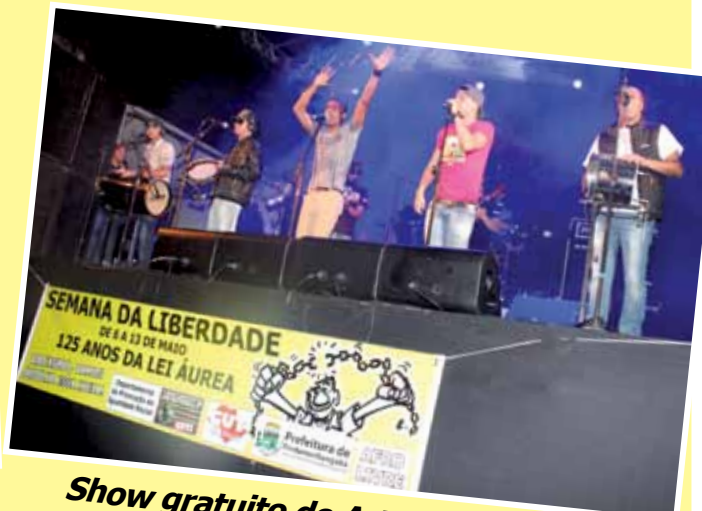
Show gratuito do Art Popular reuniu 4 mil pessoas no pátio da Prefeitura