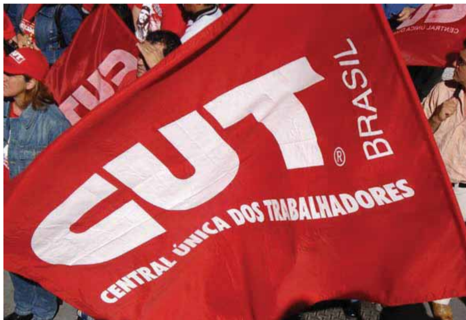
CUT vem para o 2º Turno com Chapa de Unidade dos Metalúrgicos de Taubaté e Região

Voto dos trabalhadores(as) é fundamental para a Unidade