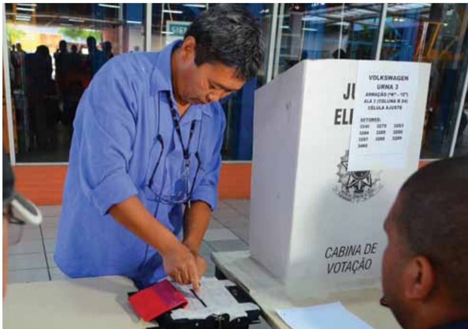
Trabalhadores tem um compromisso com o voto no 2º turno das eleições sindicais 2013

Os metalúrgicos aposentados poderão votar na sede do CSA e os sócios afastados votam na sede do Sindicato no horário das 8h às 18h. Não deixe de participar!!!