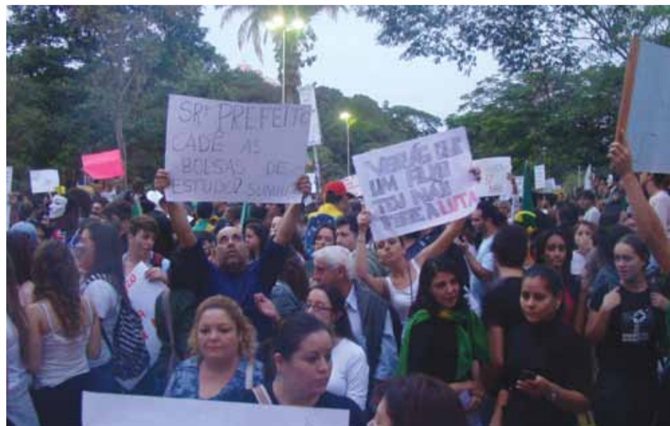
Manifestantes na Praça Santa Terezinha questionaram diversas ações do Governo Municipal

Os manifestantes deixaram bem clara sua insatisfação com os serviços públicos em Taubaté e pediram melhorias urgentes no