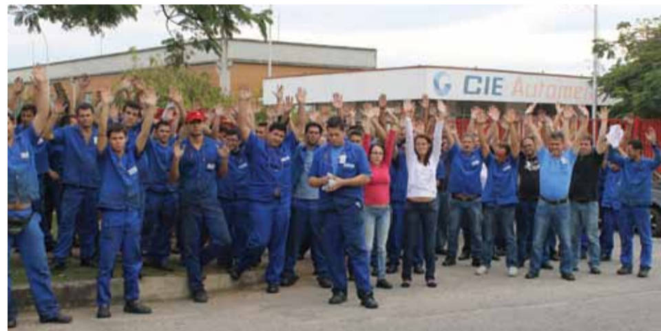
Trabalhadores aprovam em assembleia a PLR 2013 na Componentes Automotivos

Parabéns a todos os trabalhadores pelas conquistas e mobilizações pela PLR, que mostram a unidade dos Metalúrgicos de Taubaté e Região pelo crescimento econômico de nossa cidade.