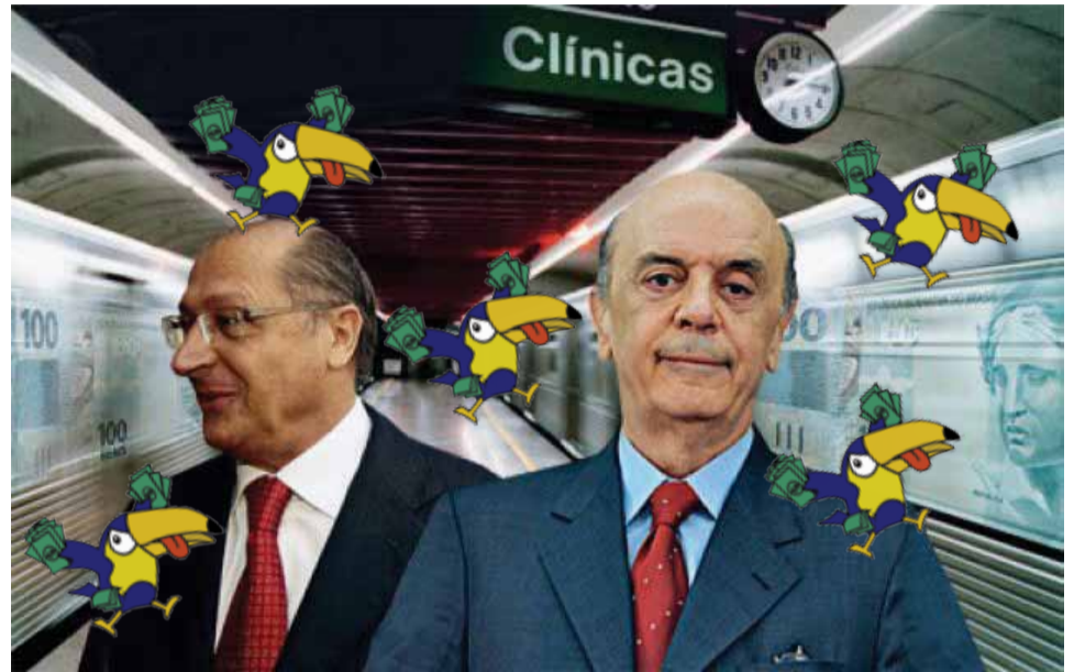
Trabalhadores exigem a apuração dos fatos e que todos os envolvidos sejam julgados e punidos

Para vencerem concorrências, com preços superfaturados, para