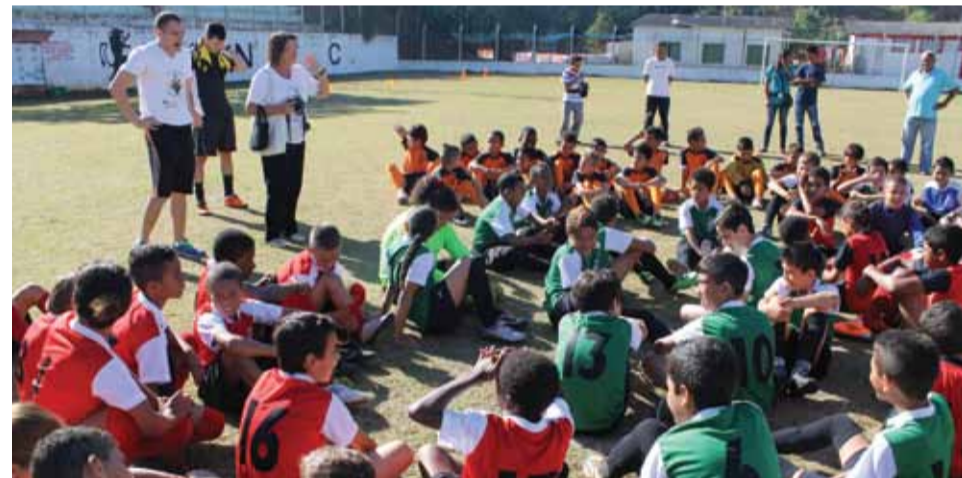
Festival de Futebol reuniu cerca de 75 crianças de 5 bairros por meio do Programa O Direito de Brincar

Taubaté foi contemplada com este programa internacional graças à parceria do Sindicato dos Metalúrgicos de Taubaté com o Projeto Esperança.