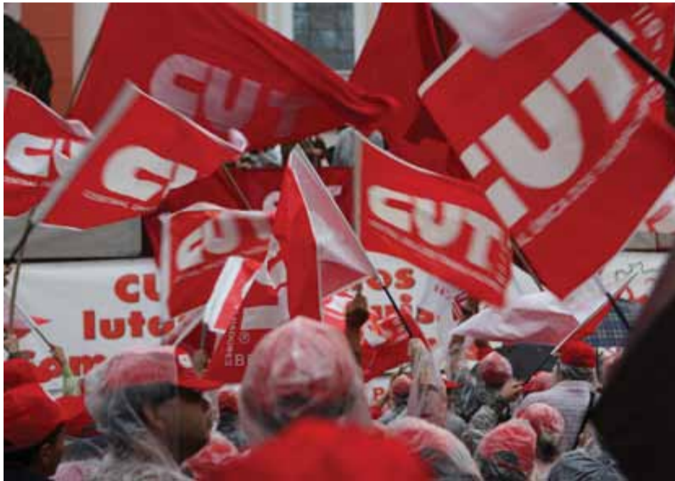
A CUT faz parte da luta da Classe Trabalhadora nos últimos 30 anos, transformando o Brasil

Central está presente nas conquistas dos trabalhadores(as)