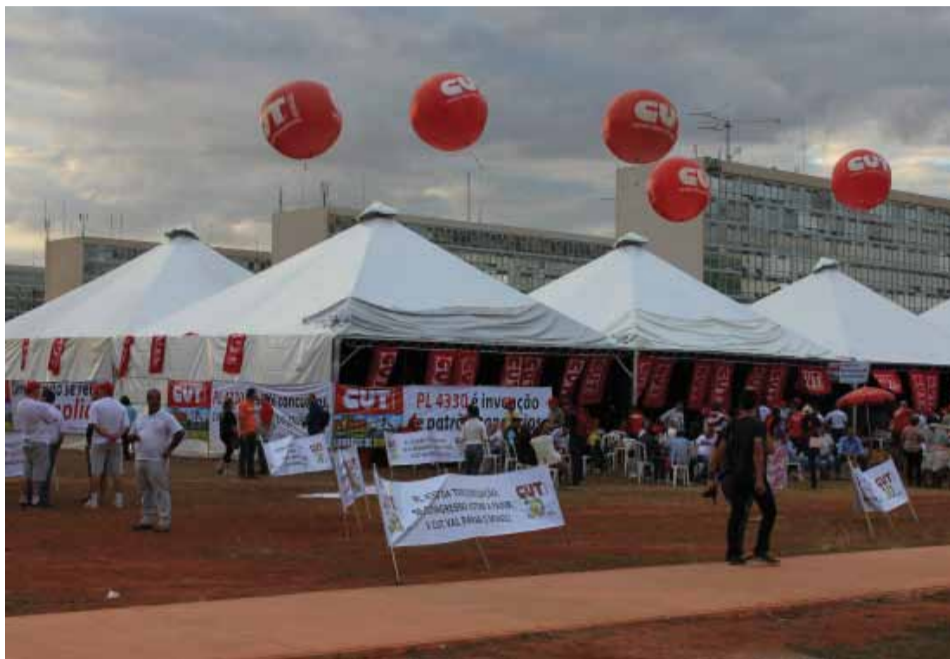
CUT mobilizada em Brasília contra o projeto de lei 4330 que trata das terceirizações no Brasil

No dia 30, a CUT também vai reafirmar a mobilização pelos demais pontos da pauta dos trabalhadores como o fim do fator previdenciário e a redução da jornada de trabalho para 40 horas sem redução de salário entre outras reivindicações.