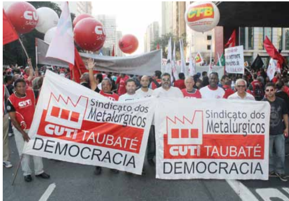
Dirigentes sindicais dos Metalúrgicos de Taubaté durante a manifestação realizada em São Paulo

Metalúrgicos de Taubaté estiveram mobilizados em São Paulo