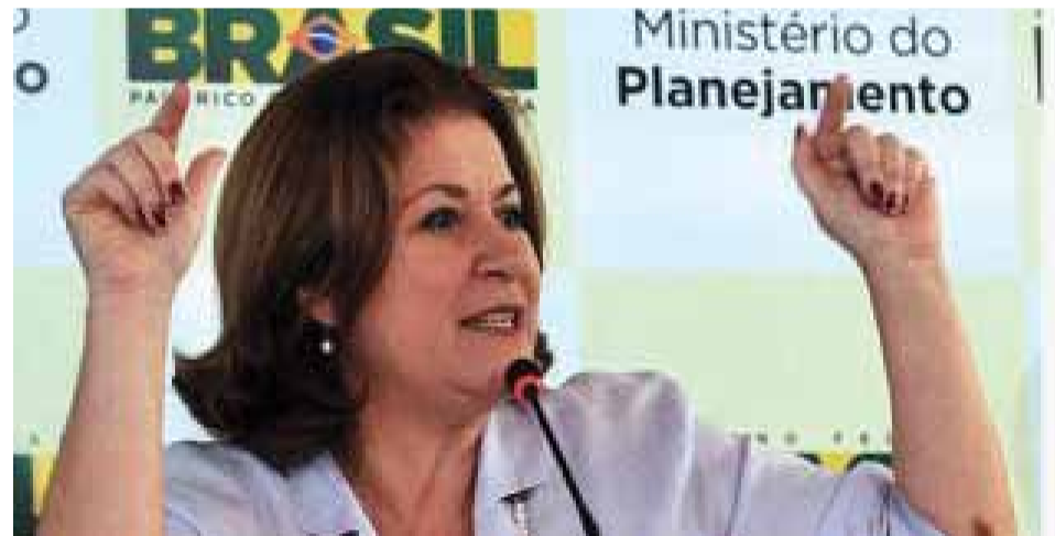
Segundo a ministra Miriam Belchior, a política do governo é responsável pela distribuição de renda

Essa política, segundo economistas, tem sido uma das responsáveis pelo aumento da distribuição de renda no Brasil, pela diminuição das desigualdades e pelo desempenho positivo da economia brasileira, mesmo numa situação de crise econômica internacional prolongada.