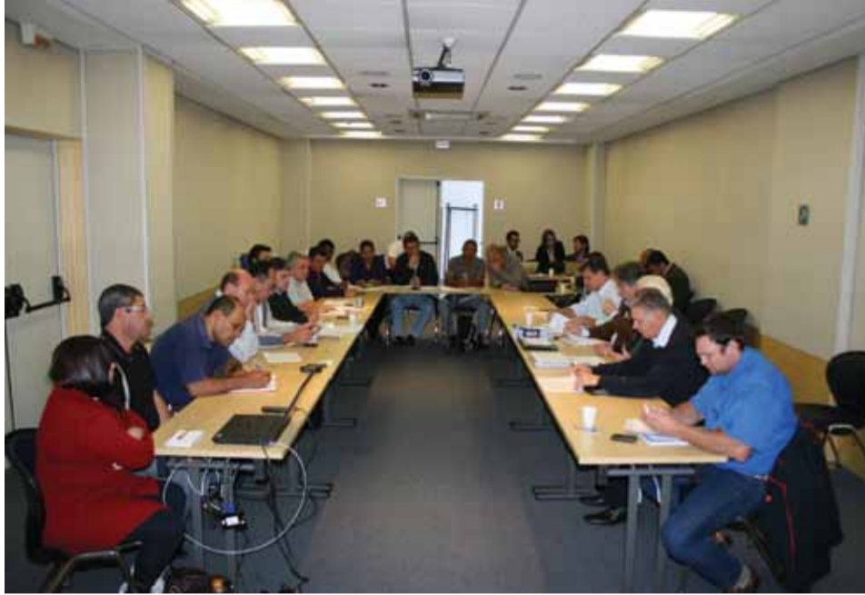
Reunião com a bancada patronal do Grupo 2 realizada na última quinta-feira, dia 29 de agosto

Já na sexta-feira, dia 06, acontece a negociação com as empresas do Grupo 10, às 10h, na sede da FIESP.