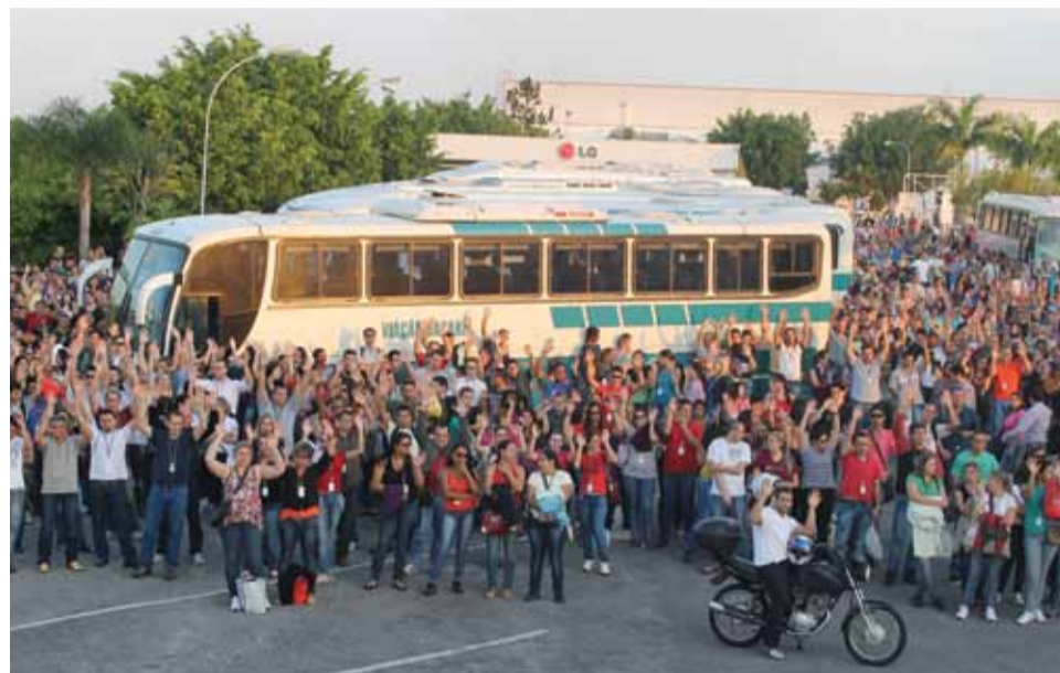
Trabalhadores na LG aprovam a proposta da Campanha Salarial em assembleia e a redução da jornada

De acordo com a proposta aprovada, a redução da jornada na LG começa em junho de 2014 e até