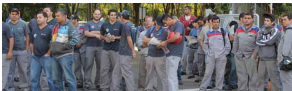
Trabalhadores na Alstom acompanham assembleia realizada na última quinta-feira, dia 26