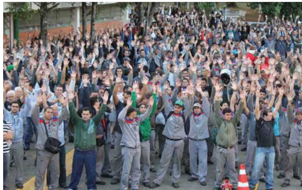
Trabalhadores na Alstom aprovam a proposta da Campanha Salarial em assembleia no dia 26

“Estamos avançando na valorização dos trabalhadores e contribuindo de forma fundamental para o crescimento econômico de