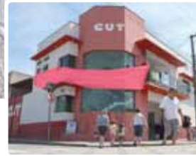
Fachada do sindicato com faixa rosa, em referência à campanha Outubro Rosa, de prevenção ao câncer de mama

Esses pequenos gestos fazem toda a diferença”, disse.