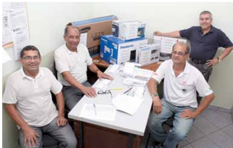
Dirigentes do Comitê, junto aos prêmios que serão sorteados no dia 14 de dezembro