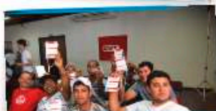
Delegados aprovaram as ações para o Plano de Lutas