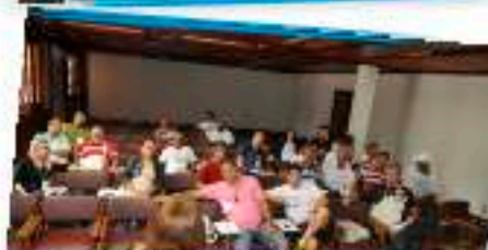
A Comunicação Sindical foi assunto tratado no Grupo 3