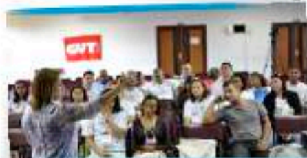
No grupo 2, os trabalhadores analisaram a Mulher e a Desigualdade Racial no Mercado de Trabalho