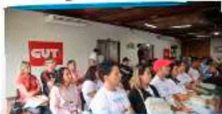
Metalúrgicos participaram do 7º Congresso.