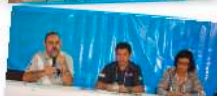
Presidente Nacional da CUT, Vagner Freitas, analisou a conjuntura política, social e econômica.