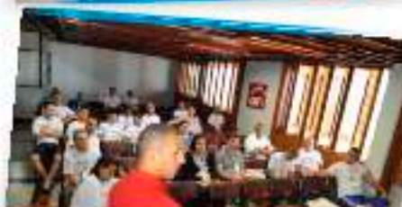
Grupo 1 debateu sobre o Jovem e o Mercado de Trabalho