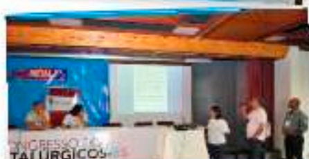
Após a discussão nos grupos, as propostas de ações foram apresentadas e colocadas em votação