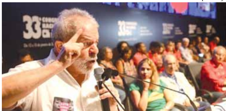
Lula durante congresso da Confederação Nacional dos Trabalhadores em Educação

vel que a gestão de Michel Temer, com apoio da mídia, acuse o governo Dilma Rousseff de “ter quebrado o país”. Ele afirmou que, desde a reeleição de Dilma, o ex-presidente da Câmara, Eduardo Cunha, trabalhou para que nenhuma de suas reformas fossem aprovadas.