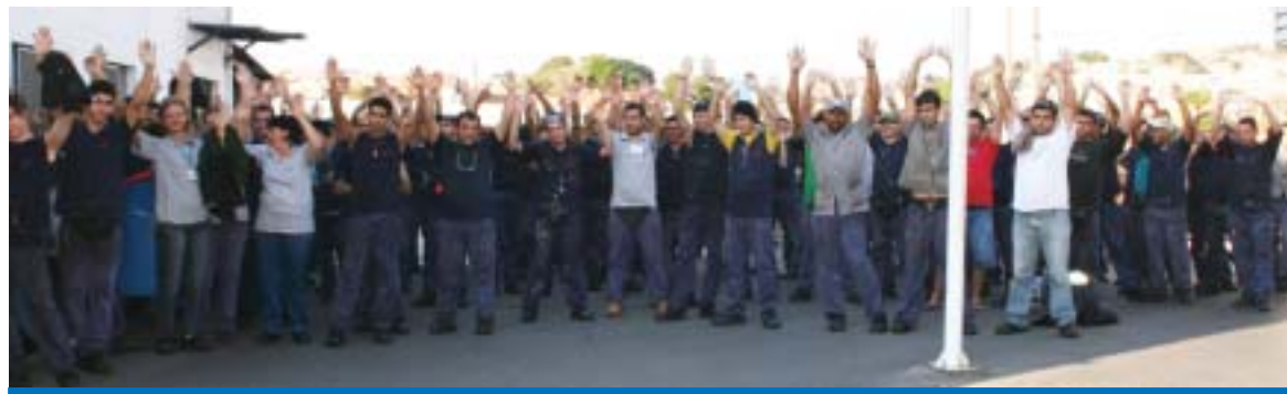
A proposta da PLR 2008 na SM Sistemas Modulares teve 100% de aprovação dos trabalhadores e trabalhadoras

Em assembléia realizada na terça-feira, dia 7, os trabalhadores na SM Sistemas Modulares aprovaram a proposta da PLR 2008.