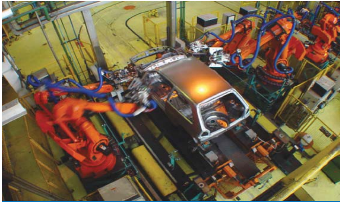
No semestre, o Gol acumula vendas de 138.887 unidades e no mês passado foi o modelo mais vendido

Em junho deste ano, a Volkswagen ficou em terceiro