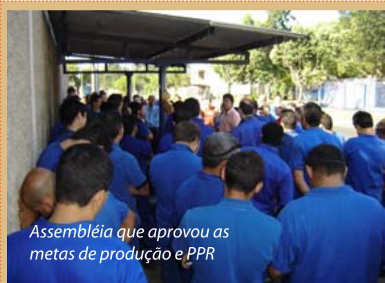
Assembleia que aprovou as metas de produção e PPR