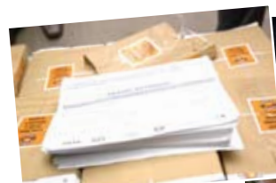
Centrais no plenário da Câmara durante ato de entrega do abaixo-assinado pela redução da jornada