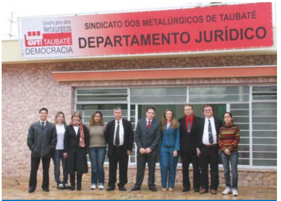
Advogados e funcionários que vão atender os sócios na nova sede do Departamento Jurídico do Sindicato

"Nosso propósito é garantir que os trabalhadores tenham suas demandas atendidas de uma forma mais eficiente, com uma estrutura moderna e um corpo jurí-