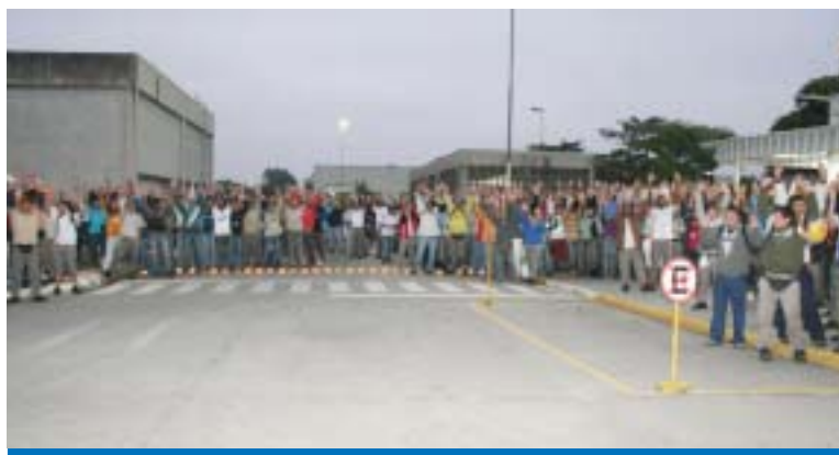
É hora de unidade e mobilização dos trabalhadores na Pelzer pela PLR

Os trabalhadores na Pelzer aprovaram o estado de greve na empresa em assembléia realizada na quinta-feira, dia 12, em razão da rejeição da proposta da PLR.