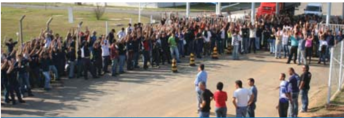
Companheiros na Autoliv dão exemplo de mobilização e unidade durante assembléia na última sexta-feira

Na sexta-feira, dia 13, os trabalhadores na Autoliv aprovaram a proposta da PLR 2008.