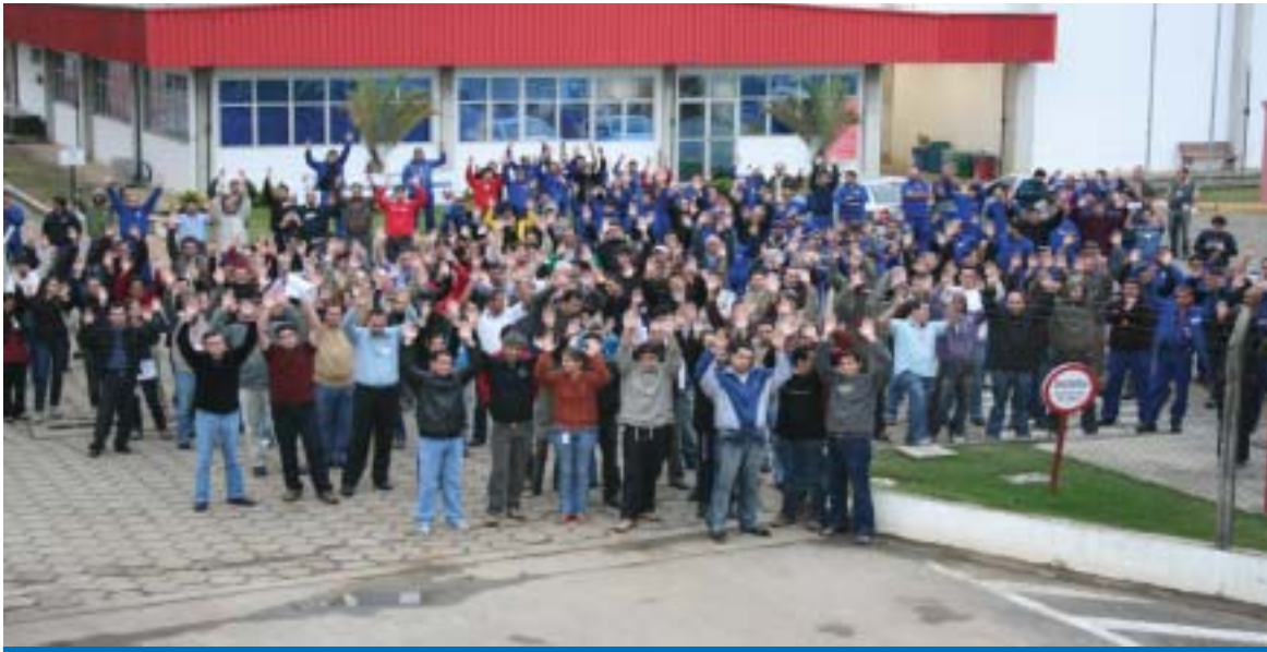
Companheiros da Cameron durante a assembléia em que foi aprovada a PLR 2008

A proposta da PLR 2008 foi aprovada em assembléia pelos trabalhadores na Cameron nesta segunda-feira, dia 16.