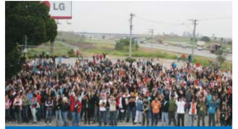
Trabalhadores na LG durante a assembléia na última quinta-feira, dia 12

Os trabalhadores e trabalhadoras na LG Electronics aprovaram em assembléia realizada na manhã da quinta-feira, dia 12, a 1ª Parcela da PLR 2008.