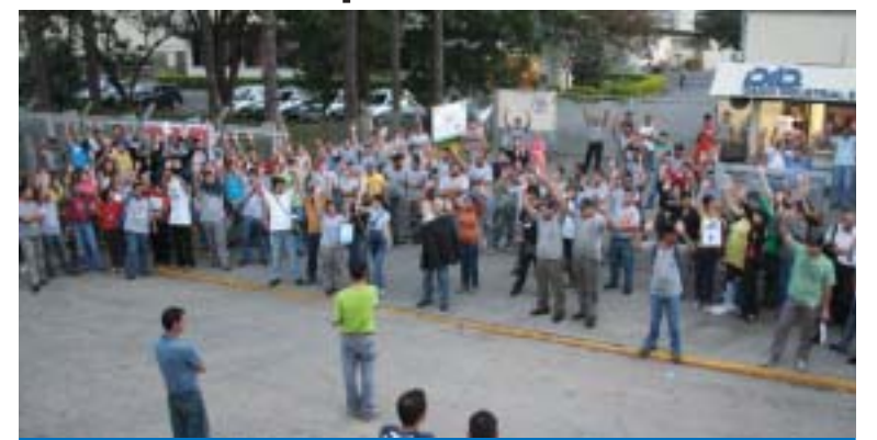
Trabalhadores na Daido durante a aprovação da proposta de PLR

Os companheiros e companheiras da Daido aprovaram a PLR 2008 em assembléia realizada na sexta-feira, dia 13.