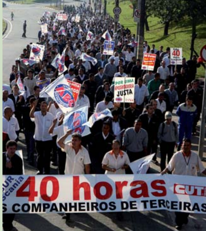
28 de Mayo, Día de Movilización y Lucha

Una jornada laboral de 40 horas semanales sin reducción de salarios es la actual bandera de lucha del movimiento sindical brasileiro.