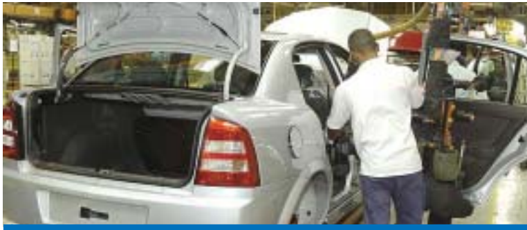
Indústria bate recordes e região precisa acompanhar este momento

O Sindicato dos Metalúrgicos de Taubaté (CUT) é solidário à luta dos trabalhadores na GM para garantir investimentos e novos produtos, geração de emprego e renda, sem redução de di-