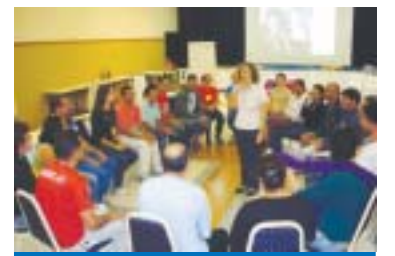
Atividade em grupo no encontro

A Formação é uma política CUT que vincula-se ao seu projeto político-sindical e tem como referência as resoluções de suas instâncias e busca capacitar os trabalhadores para a orga-