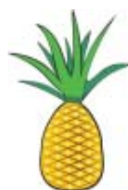
Abacaxi é pra Autocom

Porém a empresa cometeu um tremendo desrespeito com as células que não tiveram uma boa avaliação, oferecendo a estas