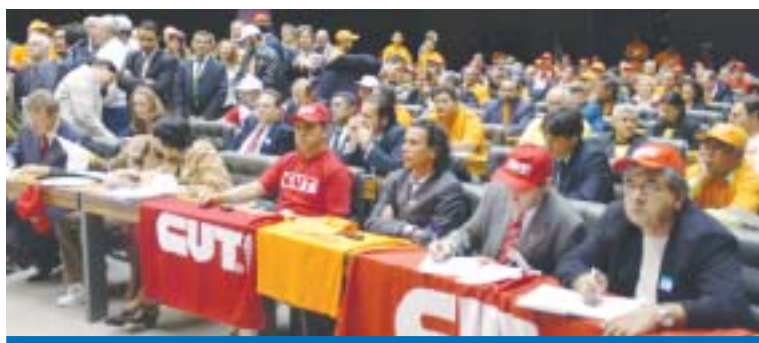
Representantes da CUT e centrais sindicais lotaram o plenário da Câmara

"Além de gerar mais empregos, a redução da jornada sem redução de salário significa qualidade de vida, já que propicia ao trabalhador e à trabalhadora mais tempo para o convívio familiar e social, mais tempo