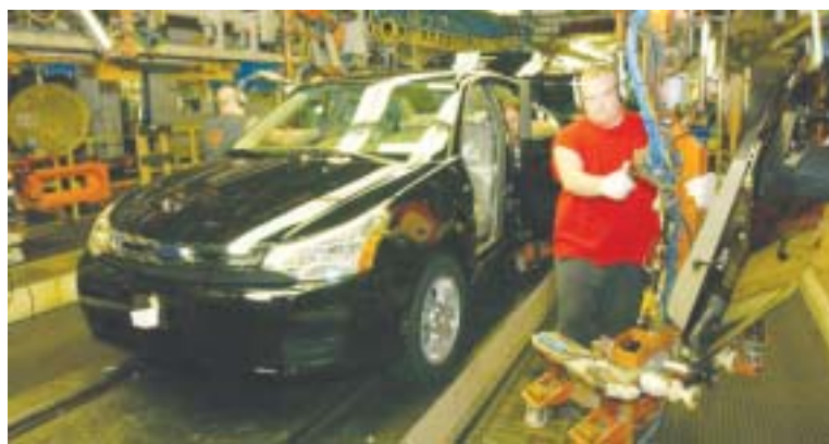
A indústria de veículos atingiu novo patamar de produção no País, diz Anfavea

As constantes revisões da Anfavea sobre suas projeções se tornaram comuns desde o ano passado, quando o mer-