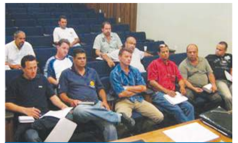
Representantes do Comitê Nacional dos Trabalhadores na Volkswagen

Um dos principais debates desse encontro será a aquisição do Grupo Volkswagen pela Porsche e a relação desta com os trabalhadores.