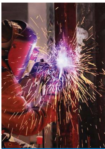
Parabéns a todos os metalúrgicos

O mártir da Inconfidência Mineira, Tiradentes, além de dentista e alferes também era ferreiro. Por isso, no dia 21 de abril também se comemora o Dia do Metalúrgico, em homenagem ao patrono da Pátria por sua luta e exemplo.