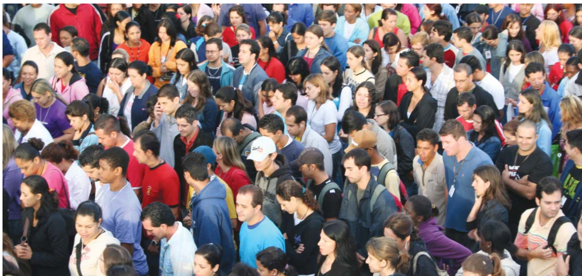
Quanto mais metalúrgicos forem sindicalizados, maior a representatividade do Sindicato na hora de negociar

forem sindicalizados, maior a mobilização e a representatividade do Sindicato na hora de negociar.