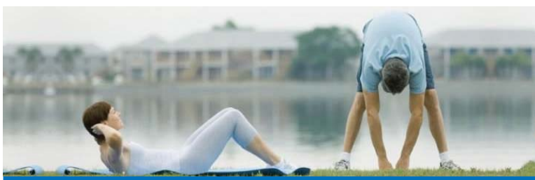
O objetivo da semana foi incentivar a prática de hábitos saudáveis

A Cipa dos Trabalhadores na Daido e o ambulatório médico da empresa realizaram a Semana Interna de Qualidade de Vida, no período de 7 a 11 de abril.