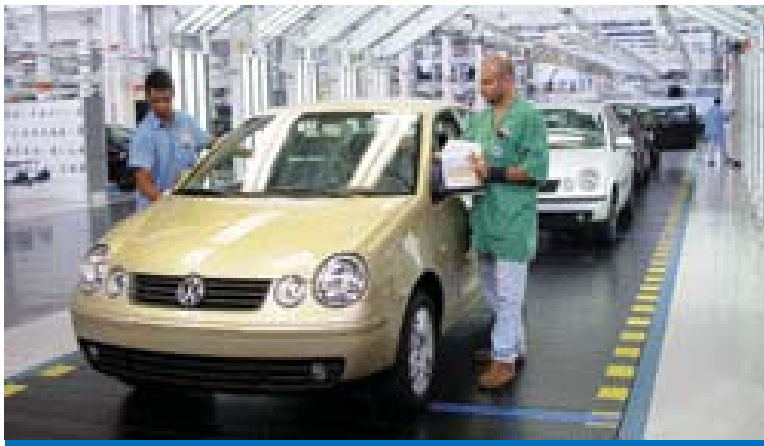
A Volkswagen espera comercializar 6,6 milhões de carros até 2018

A maior montadora europeia em vendas planeja vender cerca de 300 mil veículos do Passat CC durante o ciclo de existência do modelo, de seis a sete anos.