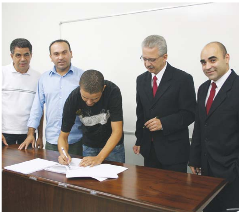
Isaac assina o convênio acompanhado por diretores da UNIMES e do Sindicato

Em breve o Sindicato estará divulgando para os associados as informações necessárias para participar dos cursos oferecidos pela UNIMES.