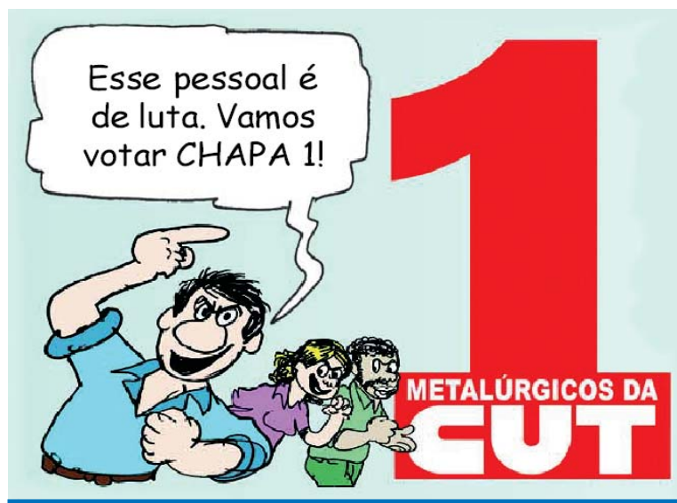
Os metalúrgicos de Taubaté apoiam a Chapa I da CUT em BH e Contagem