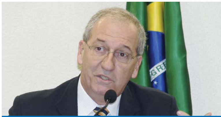
O Ministro da Comunicação Social, Franklin Martins, participa do encontro

O objetivo do encontro nacional dos metalúrgicos da CUT é discutir a as estratégias de comunicação com os trabalhadores e a elaboração de uma rede nacional de comunicação entre os sindicatos filiados à CNM/CUT.