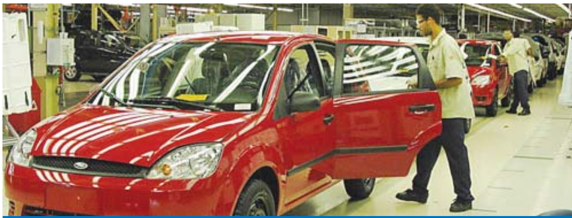
Já são 523.073 vagas criadas na indústria metalúrgica desde 1º de janeiro de 2003, no início do governo Lula

Entre os meses de janeiro e dezembro de 2007, o saldo positivo de contratações chegou a 180.242 postos de trabalho. Um crescimento de 10,5% - e o segundo maior desde 2003, quando o ramo metalúrgico retomou o crescimento acentuado na pro-