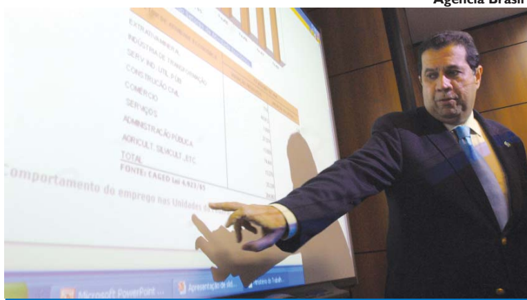
O ministro do Trabalho, Carlos Lupi apresenta os dados do Caged

Os números do Caged são baseados nas contratações e demissões de trabalhadores regidos pela Consolidação das Leis do Trabalho (CLT).