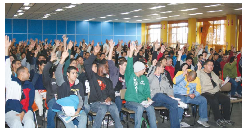
Integração dos trabalhadores na Volks realizada no dia 4 de junho de 2007

O Sindicato e a Comissão de Fábrica esperam uma resposta da companhia no que diz respeito ao reajuste de 12%, pois, entre o acordo coletivo e a convenção coletiva, os trabalhadores tem a proteção da norma mais