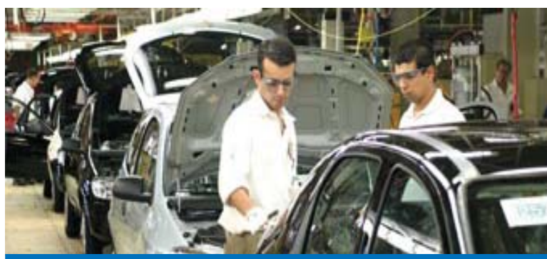
SemLutas não engana mais os trabalhadores na GM de São José