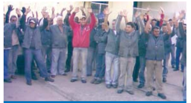
Companheiros da Equitextil aprovam a PLR 2008 em assembléia

Em assembléia realizada na quinta-feira, dia 17, os companheiros da Equitextil aprovaram a proposta da PLR.