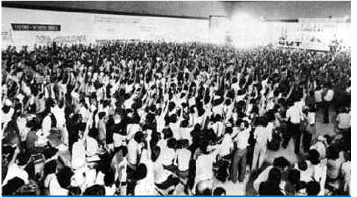
A CUT foi fundada em 28 de agosto de 1983 e hoje representa 22 milhões de trabalhadores no Brasil

O objetivo desta grande assembléia é reforçar a unidade de ação da CUT para as atividades e campanhas que serão realizadas no segundo semestre.