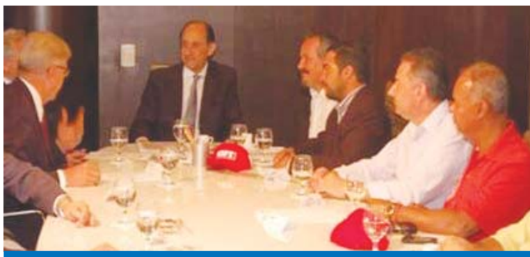
Dirigentes sindicais e empresários durante encontro ocorrido na Fiesp

Empresários e sindicalistas decidiram criar uma agenda comum de trabalho que atendam interesses nacionais, cujo