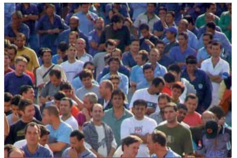
O município de Taubaté teve o maior número de contratações na região

De janeiro a junho, foram admitidos 19.445 trabalhadores na cidade contra 15.747 demissões. O saldo foi de 3.698 vagas.