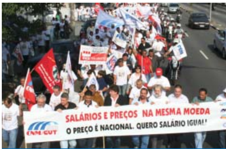
É hora de unidade e mobilização de todos os metalúrgicos do Brasil