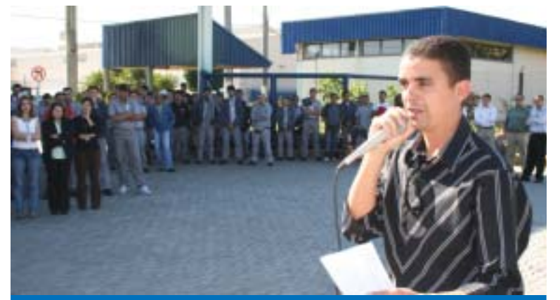
Trabalhadores devem se manter mobilizados, afirma o presidente Isaac

Os trabalhadores na Rio Negro aprovaram o Estado de Greve em assembléia na última sexta-feira, dia 18.