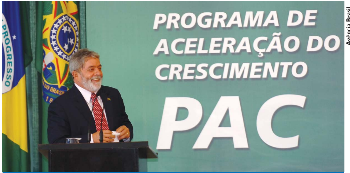
O Governo Lula cumpre seu compromisso de promover um desenvolvimento sustentado com igualdade social

A educação também tem recebido grandes investimentos com o PDE (Plano de Desenvolvimento da Educa-