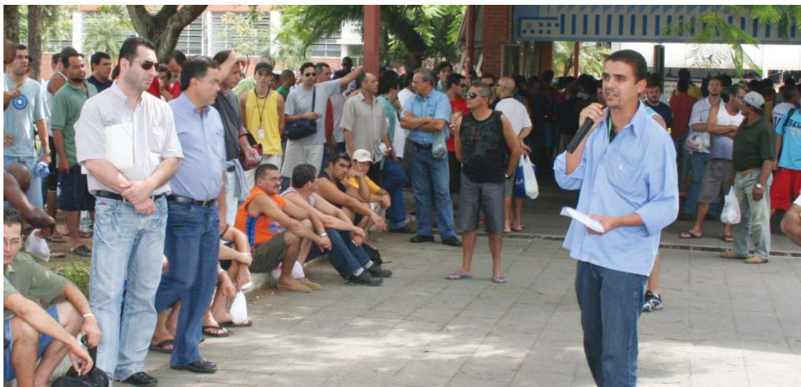
O presidente Isaac fala aos trabalhadores: "Não abriremos mão dos 12% para os companheiros temporários".

e o acordo aprovado, os trabalhadores tem a proteção da norma mais favorável, que é o acordo que determina