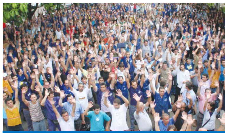
A unidade dos trabalhadores é importante para a garantia de conquistas