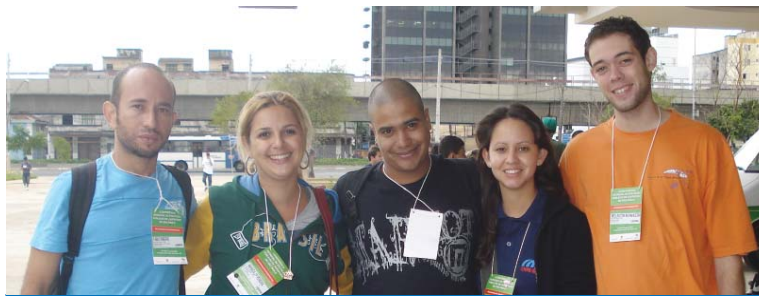
Representantes da Juventude da CUT apresentaram propostas na Conferência

Os representantes da CUT apresentaram propostas na área de Educação e Cultura como a permanência do jovem na escola de forma qualificada e democrática, e a