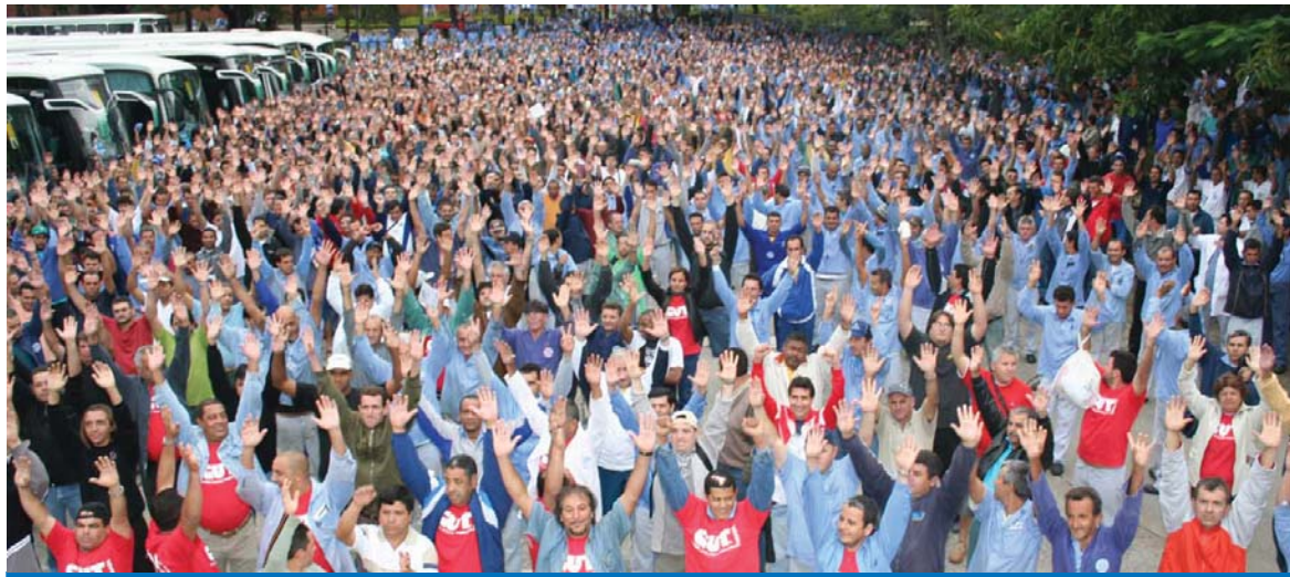
Boas negociações e acordos vem garantindo vitórias para os trabalhadores e para a economia da região

A Volkswagen anunciou na semana passada a contratação de 181 trabalhadores na unidade de Taubaté para atender a demanda de produção e das vendas do mercado automobilístico. Os novos contratados iniciam suas atividades na