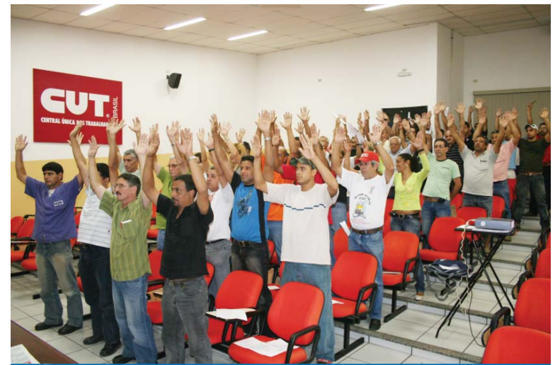
Assembléia aprova os nomes dos delegados para a Plenária Nacional

Na quarta-feira, dia 21, foram eleitos em assembléia na sede do Sindicato os delegados dos metalúrgicos de Taubaté para as Plenárias Estatutárias das CUTs Estadual e Nacional.