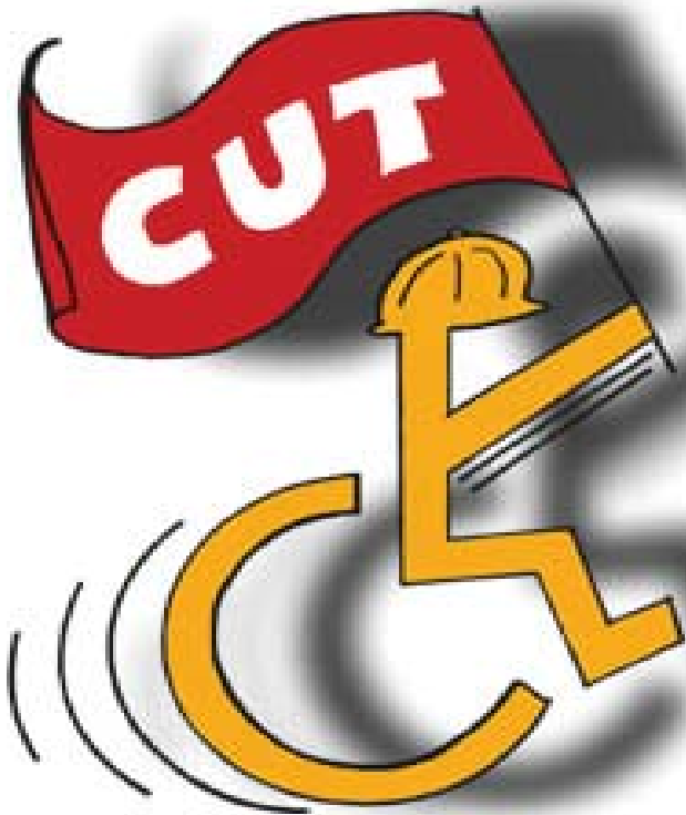
CUT garante respeito aos trabalhadores portadores de deficiências

O evento tem como público alvo os dirigentes sindicais cutistas, visando a atividade junto aos trabalhadores portadores de necessidades especiais e deficiências.