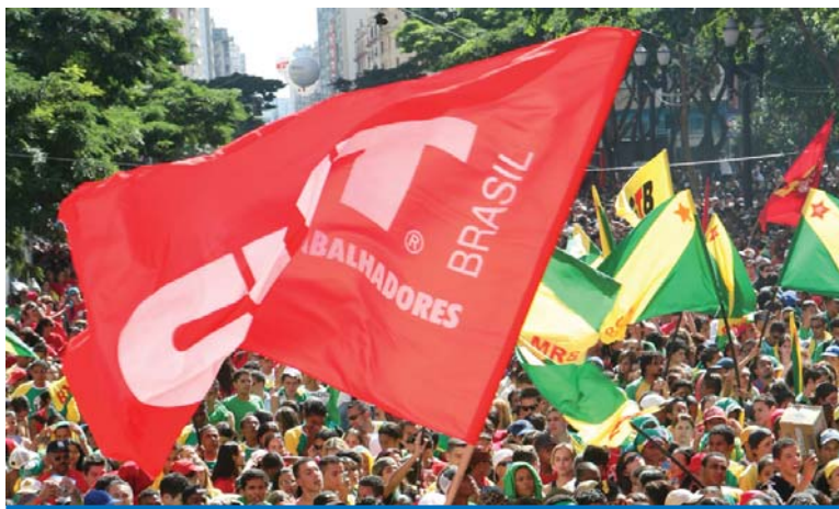
CUT é a central mais representativa dos trabalhadores brasileiros

Das entidades já recadastradas, 42,3% são filiadas à CUT.